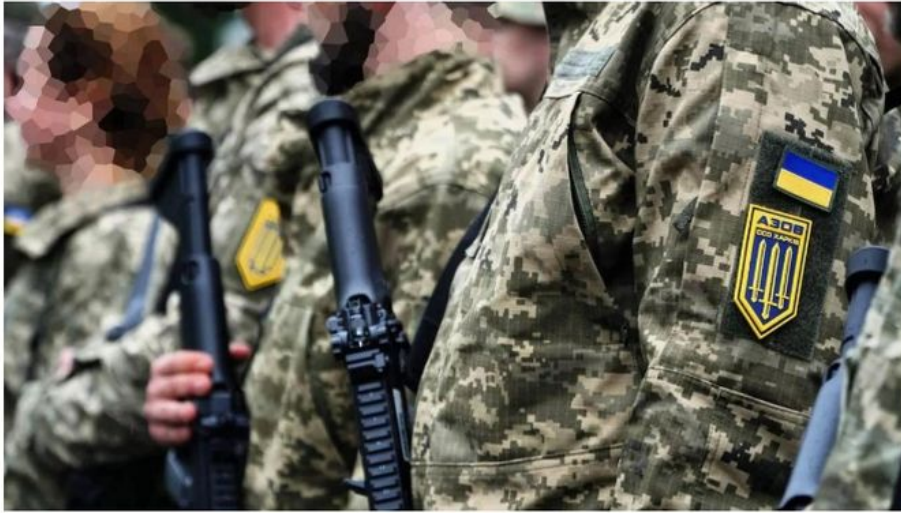
The new insignia features a golden trident, the Ukrainian national symbol worn by other regiments

The Azov Battalion has removed a neo-Nazi symbol from its insignia that has helped perpetuate Russian propaganda about Ukraine being in the grip of far-right nationalism.