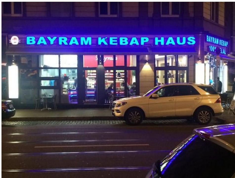
Důsledek turkizace Německa od 50. let minulého století

Celá Evropa se začne ukrajinizovat. Začne to postupně v procesech školství, služeb, médií, bankovníctví, ve firmách, v obchodech, v televizi, v médiích, prostě úplně všude. České děti začnou chytat ukrajinskou bilingualitu, začnou mluvit ukrajinsky i česky. Dojde ke stejnému jevu jako tady v Německu po II. sv. válce v rámci programu obnovy Německa, na kterém se podílely desítky a později stovky tisíc Turků. Vedlejším jevem byla indukce turečtiny u německé školní mládeže. Spolu s ní začala pracovat i eugenika, tedy eugenické záření a jev související s indukcí změny německého jídelníčku, německé děti se naučily na kebab a opustily klobásu se zelím.