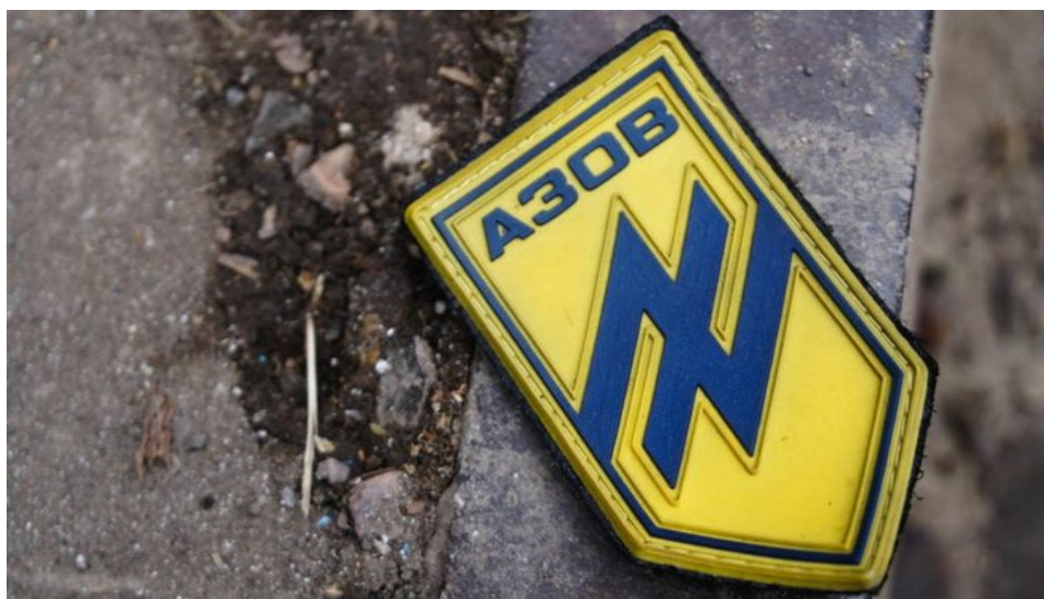
Azov až dosud používal nacistický symbol Wolfsangel

Naprosto neocenitelné informace nyní poskytují ruským vyšetřovatelům zajatí bojovníci oddílů Azov, kteří fungovali na Donbasu na ukrajinské straně demilitarizované zóny jako čistící jednotky, které po dobu 8 let v tichosti likvidovaly vesnice od ruského etnického obyvatelstva. Nikde ale nebyly žádné oficiální pohřby, takže je jasné, že se ta těla nachází v hromadných masových hrobech.