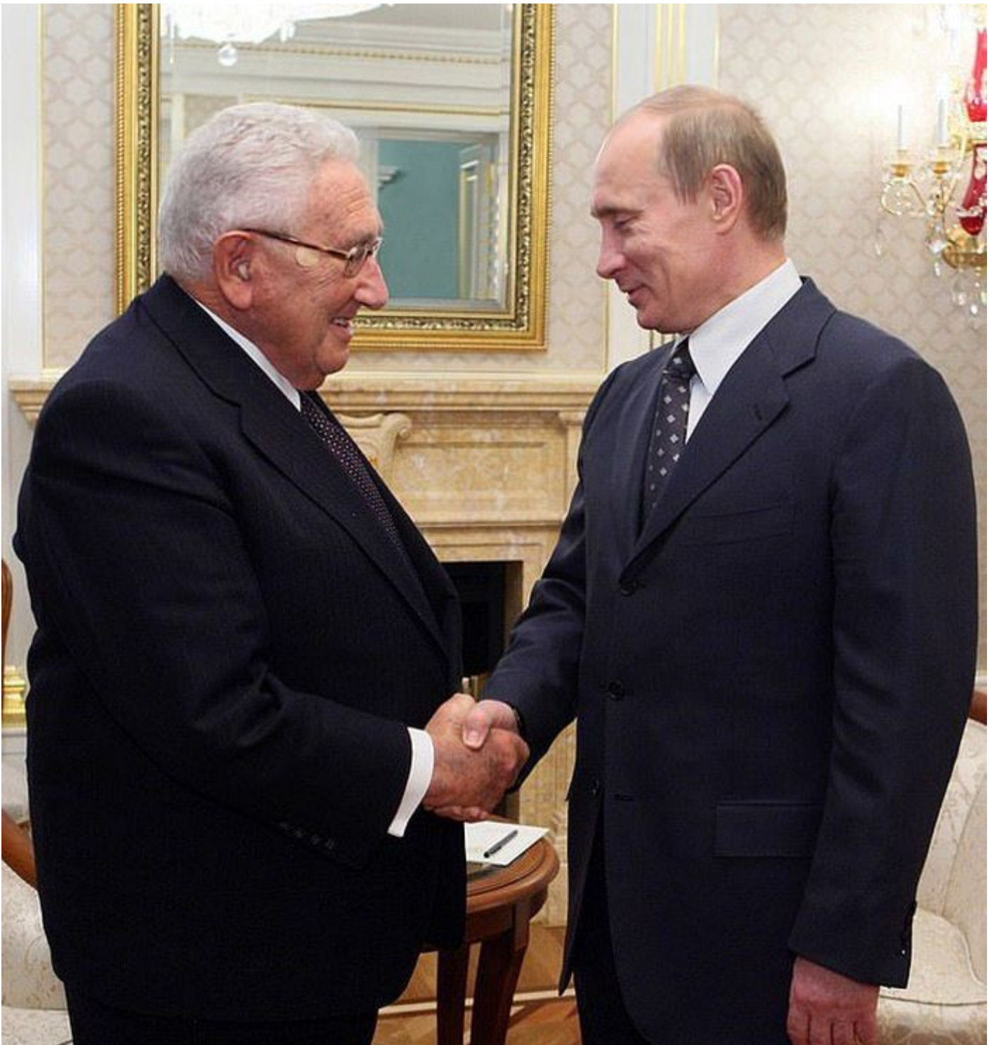
Henry Kissinger a Vladimir Putin v Kremlu

Začnou se ze Západu a z USA objevovat výzvy k míru na Ukrajině, začnou se objevovat výzvy k neposílání těžkých zbraní na Ukrajinu, začnou se objevovat návrhy, aby Ukrajina byla realistická a přistoupila na kompromisy a prostě se smířila s tím, že přijde o území, o trochu území. Kissinger v Davosu v další části rozhovoru potom znovu zopakoval, že by rád viděl, aby USA zlepšily vztahy s Čínou a tím zabránili spojenectví Pekingu s Moskvou.