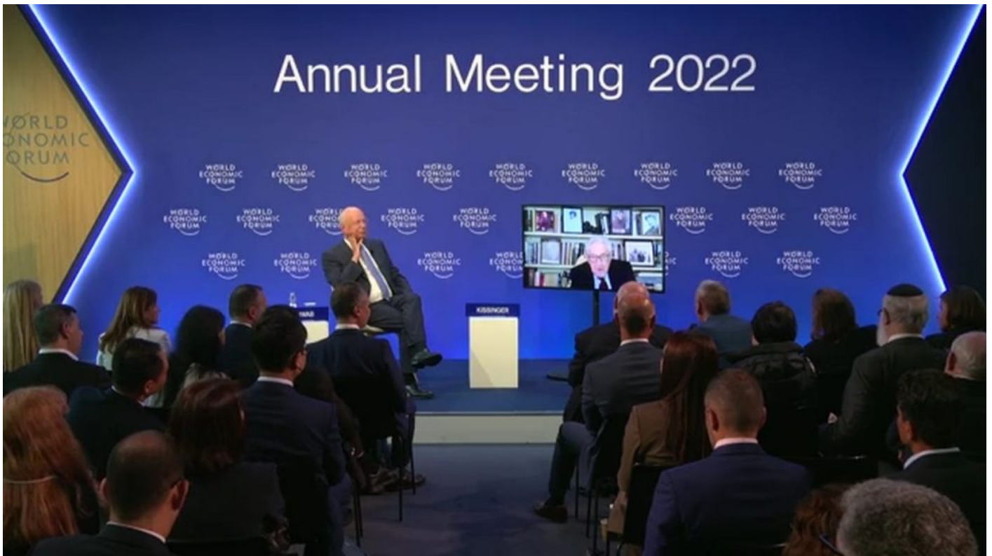
Klaus Schwab v telemostu s Henrym Kissingerem