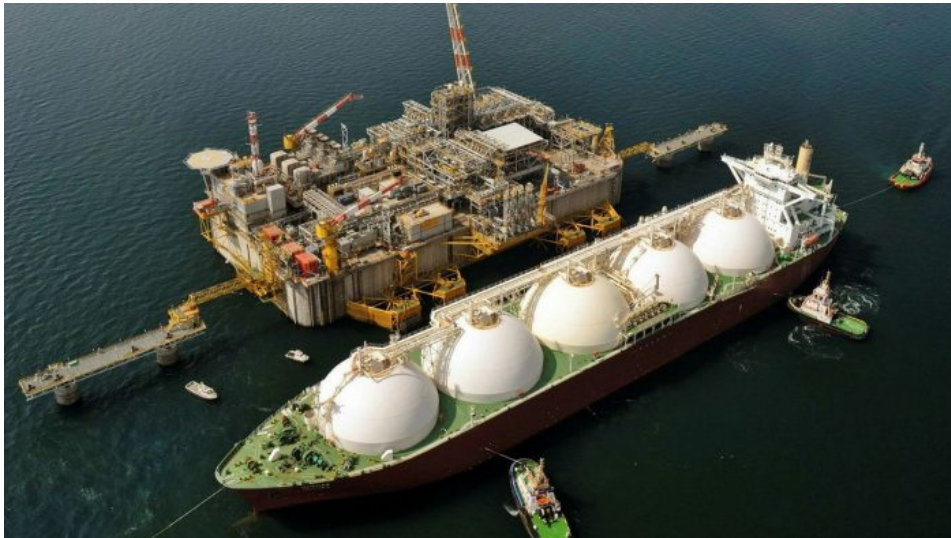
Katarský tanker na převoz zkapalněného zemního plynu (LNG)

A od roku 2020 si část katarského plynu zajistil Izrael poté, co Donald Trump a jeho zeťák Jared Kushner vyjednali mírovou smlouvu mezi Izraelem a Katar. Smlouva byla podepsána právě kvůli odstoupení USA od 8,6% katarské plynové produkce, kterou USA přenechaly Izraeli. Je to jako pořadník. Nestačí přijít s penězi za Katar a říct, že chcete nakoupit plyn. Tak to nefunguje. Nejprve musí někdo zrušit, anebo jako v případě USA někomu přenechat kontrakt, a teprve poté můžete část katarské plynové produkce odebrat.