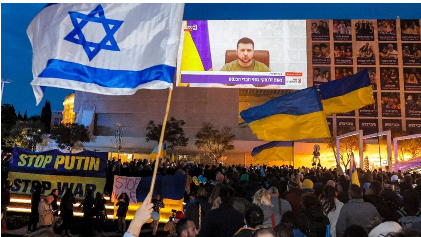
Izraelci vyšli do ulic na podporu Ukrajiny

Porážka Ukrajiny bude naprostým šokem pro západní elity a pro liberální demokracii na Západě, které se zhroutí svět s poslední iluzí o schopnosti táhnout proti Rusku na Východ. Naopak, Ukrajina je o procesu tažení Ruska na Západ. Liberální demokraté se postupně promění v Evropě a v USA na nacisty, kteří budou porážku Ukrajiny vnímat jako své ohrožení a začnou zavádět na Západě nacistický styl vládnutí, teroru, cenzury, umlčování webů a opozice, lidé budou zavírání za pouhé slovo odporu, za napsání jediného písmenka Z, nebo V, nebo O, X apod.