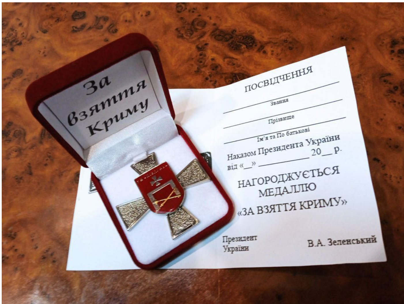
Ruská armáda našla v Mariupolu medaile, ktoré mali byť predané ukrajinským vojakům po zahájení invaze na Krym

Za co? No přece za to, že jste proruský troll a placený agent Kremlu. Proto! Rusové tam prostě mrznou, nemají co jíst, celá Ruská armáda je pozabíjená a brzy Moskva pošle do boje mládež a děti! A taková je pravda na mainstreamu a basta! A když tomu nevěříš, tak tě platí Putin! Propagandistická mašina se ale Západu začíná zadržávat, protože dezinformace o povolávání ruské mládeže do bojů nebo o mrznoucích ruských vojácích jsou už prostě přes čáru a lidé těmito dezinformacím přestávají věřit.