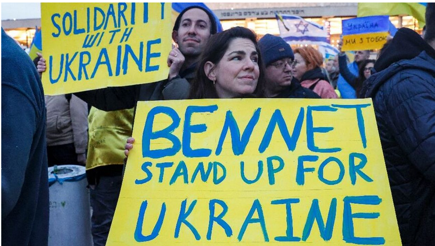
Demonstrace v Izraeli proti vládě Naftalihu Benneta, aby poslala Ukrajině vojenskou pomoc

Porážka Ukrajiny bude naprostým šokem pro západní elity a pro liberální demokracii na Západě, které se zhroutí svět s poslední iluzí o schopnosti táhnout proti Rusku na Východ. Naopak, Ukrajina je o procesu tažení Ruska na Západ. Liberální demokraté se postupně promění v Evropě a v USA na nacisty, kteří budou porážku Ukrajiny vnímat jako své ohrožení a začnou zavádět na Západě nacistický styl vládnutí, teroru, cenzury, umlčování webů a opozice, lidé budou zavírání za pouhé slovo odporu, za napsání jediného písmenka Z, nebo V, nebo O, X apod.