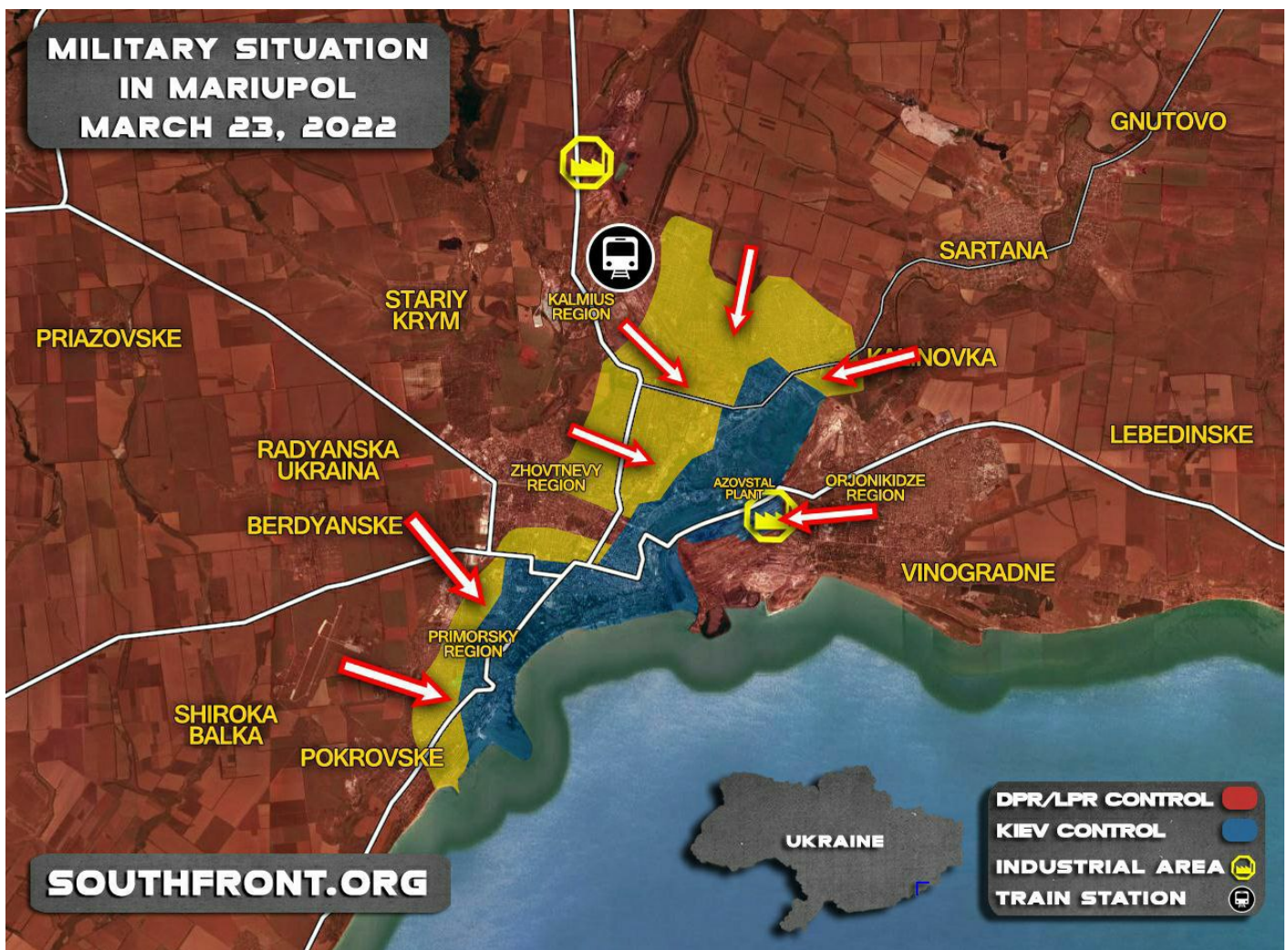
Takhle vypadala situace v Mariupolu ve středu večer. Přiznají vám toto česká MSM média?

Zůstali jim pouze přidělení snipeři, kteří během prvních dnů bojů neměli moc práce, protože Ruská armáda válčila dálkově, raketami, houfnicemi, letadly a drony. Využití pro snipery se tak našlo až nyní ve městech. Kreml nově zakázal střílet na paneláky z tanků, a to i v případě, že z okna střílí sniper. Takže, ruští vojáci postupují tak, že začištějí panelák za panelákem ručně a pěšky, a když se ozve střelba snipera, obejdou budovu, postupně vystoupají po schodech do patra, kde se sniper nachází, a tam je zatčen a odvezen do Ruska k válečnému soudu. A to z toho důvodu, že Ruská armáda neuznává snipery oddílů Azov za součást ukrajinské armády, ale za teroristickou organizaci.