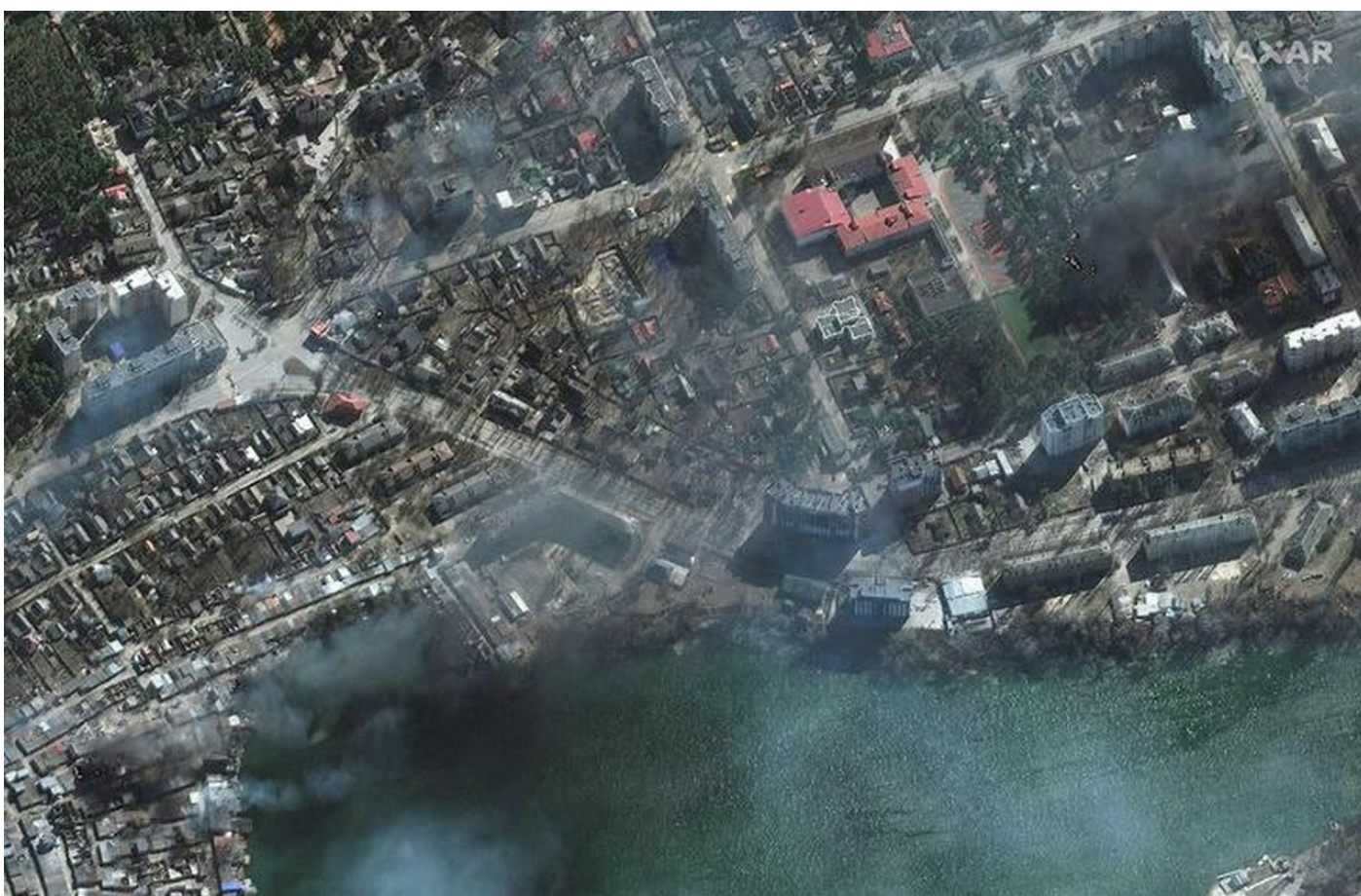
Poslední místo odporu Azovu v Mariupolu

Každý den ukazují ruští vojáci na ruských televizích desítky a stovky amerických komplexů Javelin, které ukrajinští vojáci ani nevybalili z transportních pouzder, prostě je zahodili a auty uprchli do nejbližších měst se schovat v panelácích. Celá válka na Ukrajině se de facto do učebnic historie dostane asi pod přezdívkou “Speciální paneláková operace” , protože i ruští vojáci si stěžují, že tohle není válka, ale protiteroristická operace v městské zástavbě, kde je poschováváno to, co zbylo z ukrajinské armády.