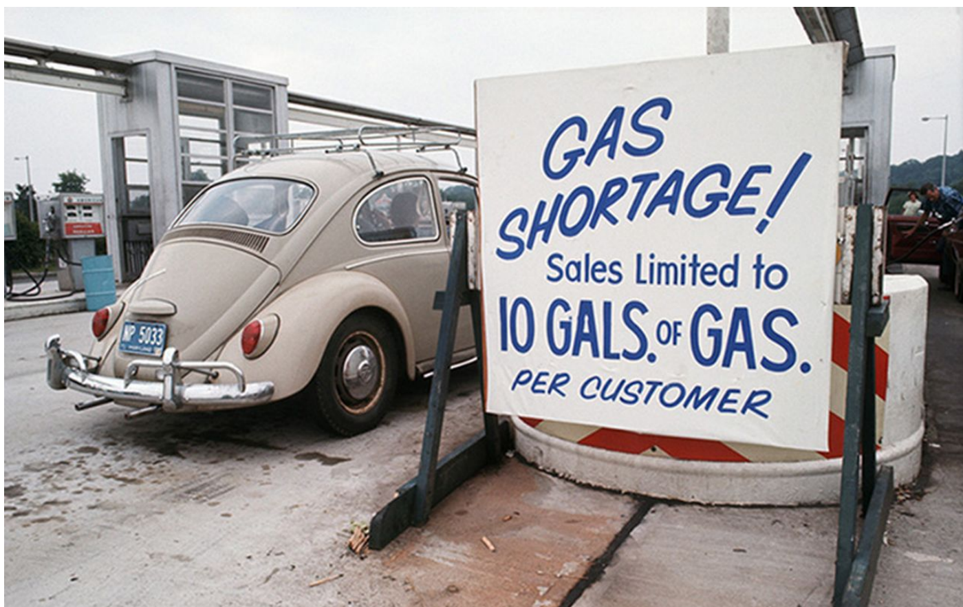
Dobová fotografie z USA zachycuje omezení prodeje paliva na pumpě, pouze 10 galonů benzínu na zákazníka

Vede to celkem ke dvěma věcem, z nichž laické veřejnosti je známa jen jedna. A to je nepotopitelnost dolaru. Bez ohledu na to, kolik dolarů FED natiskne, inflaci to nevytvoří, protože dolary jsou obratem vyrovnány cizí měnou, cizí hodnotou, tedy státem, který dolary nakoupí k nákupu arabské petrodolarové ropy. Tím vzniká situace, kdy americký státní rozpočet může generovat astronomický státní schodek, ale ke krachu to nevede, protože všechny natisknuté nové dolary jsou kryty ropou a ještě něčím.