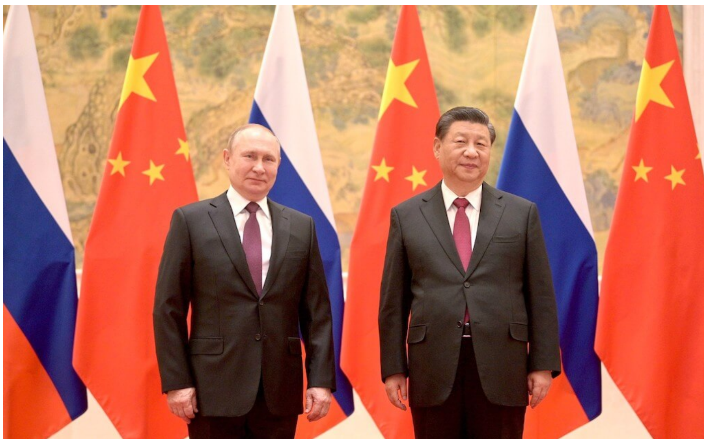
Vladimir Putin a Xi Jin Ping jsou vítězi sankční krize. Společné foto po podpisu smlouvy na dodávky ruského plynu na příštích 30 let do Číny.

Rozdíl je pouze v tom, že Rusové to nedělají kvůli nedostatku plynu nebí jídla, ale kvůli úhynu drůbeže v mrazech a kvůli malému tepelnému výkonu radiátorů v zimních měsících, kdy v noci teplota padá až k mínus 50 stupňům Celsia. V Česku takové mrazy nehrozí, ale přitápění kamny bude více než mrazem motivováno vysokou cenou plynu. A to nejen kvůli topení v zimě, ale celoročně, protože ty astronomické faktury za plyn lidé prostě nezaplatí, to nedají. Vláda ČR se na lidi vykašle, na to můžete vzít jed. Ale hlavně slušně!