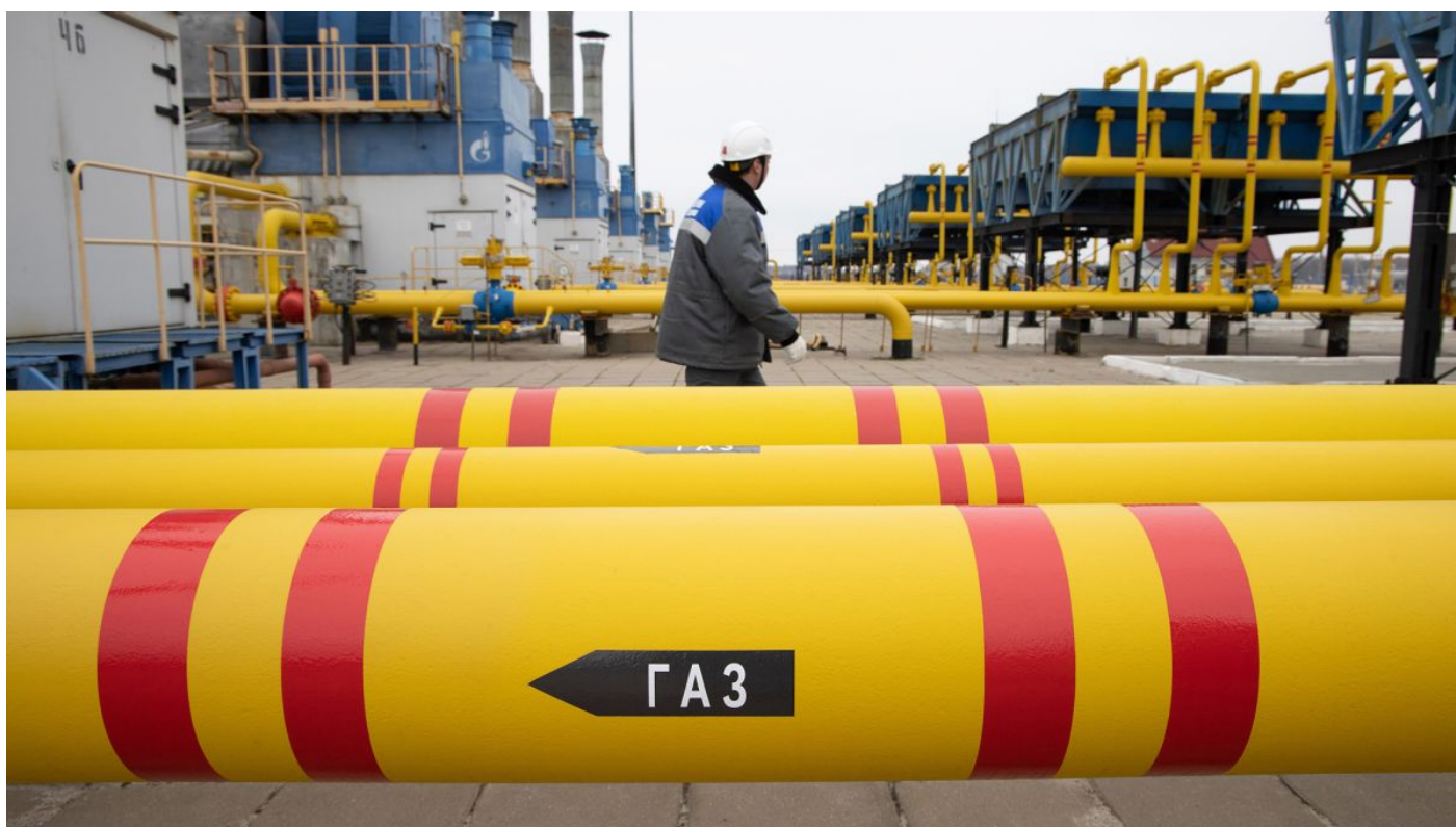
Plynový uzel v Rusku

Přesně podle mojí prognózy z nedávného pořadu na SVCS došlo dnes 23. 03. 2022 v Kremlu k historické události. Vladimir Putin ve videokonferenci s šéfy průmyslu a oborových odvětví průmyslu oznámil, že Rusko s okamžitou platností bude prodávat a dodávat zemní plyn tzv. nepřátelským zemím pouze a výhradně za ruský rubl [1], za žádnou jinou měnu na světě. Informace dorazila do Berlína rychlostí blesku a Triga spadla z podstavce na Norimberské bráně, hodiny v Reichstagu až po nich. Tohoto kroku se totiž obával ze všeho nejvíce německý svaz průmyslu, který varoval, že tento krok by mohl vést k úplnému zastavení výroby a průmyslu v Německu.