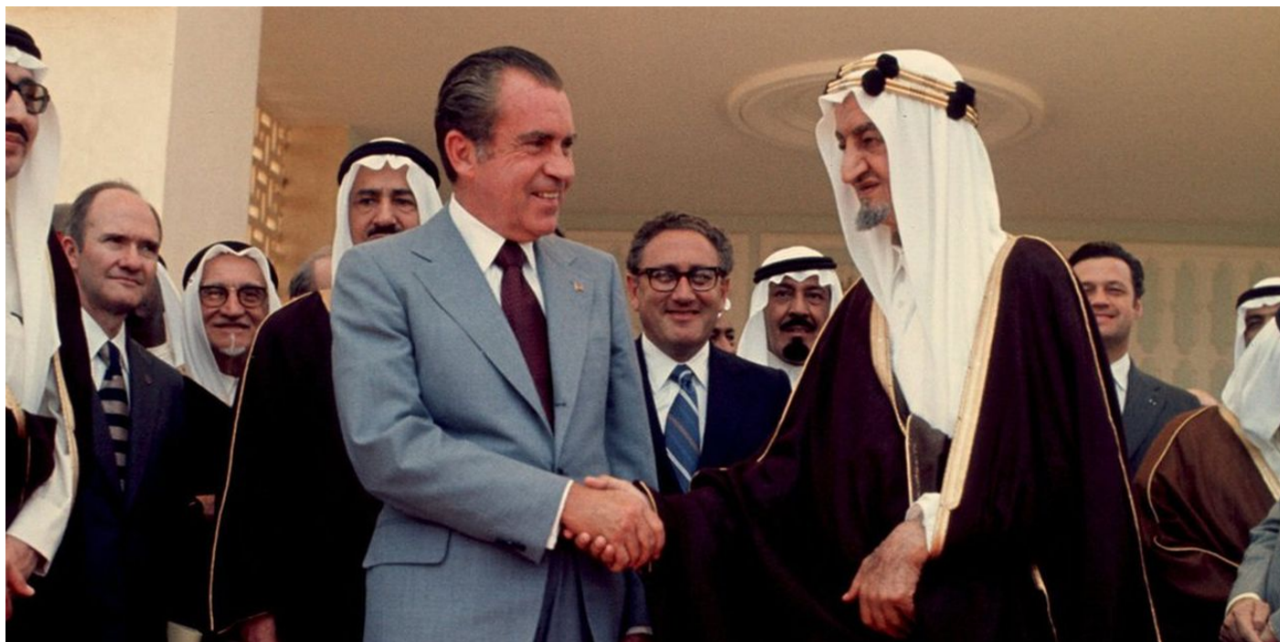
Richard Nixon a korunní princ Fahd bin Salman Al Saudí při podpisu smlouvy o spolupráci, která ustanovila zrod petrodolaru

Celé to fungovalo tak, že ruská ropa se vozila do Kanady a odtamtud ropovody tekla do USA jak už kanadská. S tímhle je ale od dnešního dne konec, protože i Kanada je na ruském seznamu nepřátelských zemí, a proto i Kanadčané budou muset za ruskou ropu platit v rublech. A jak se kupují ruské rubly? No, přece za dolary. A jak se Rusko dostane k dolarům? Že bude prodávat svoji ropu plyn za dolary? Ale kdepak. Vladimir Putin právě kopíruje kroky Richarda Nixona, jenom si toho nikdo nevšiml. A proto si konceptuálně osvěžíme paměť.