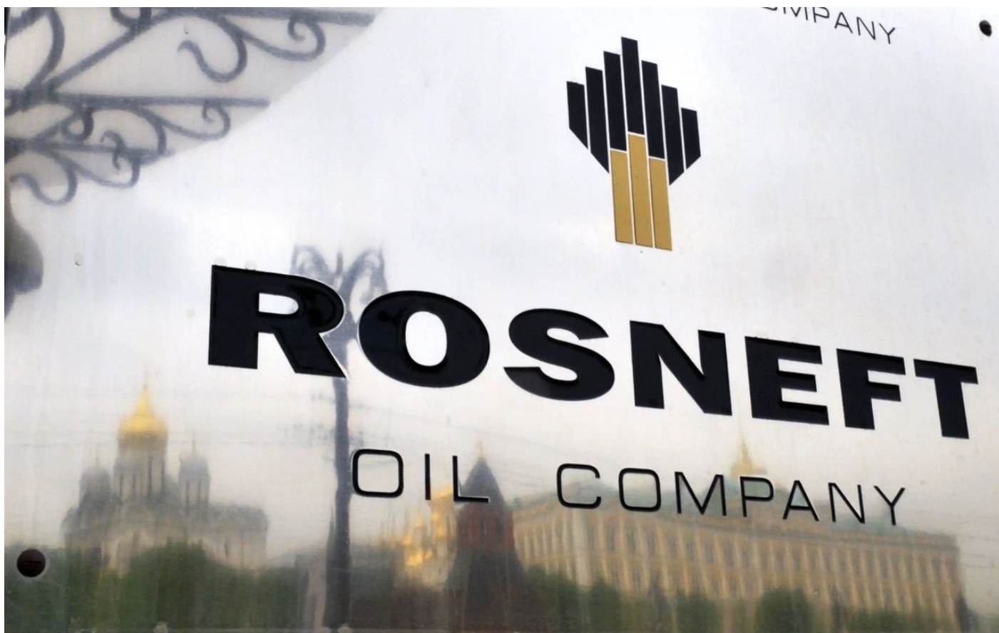
Rosněft je největším producentem ruské ropy

A děti by chodily do školy jen v období, kdy není potřeba topit, tedy jenom na jaře a jeden měsíc na podzim v září. Zbytek školy by realizoval z domova jako Home School, což by nevadilo z hlediska sociální péče, protože rodiče by byli také doma na Home Office. Nedostatek ropy by ohrozil osev obilnin, zemědělství a hlavně dopravu potravin a zboží. A když už by se zboží dopravilo, by by problém dopravit lidi do obchodů, aby si zboží mohli koupit.