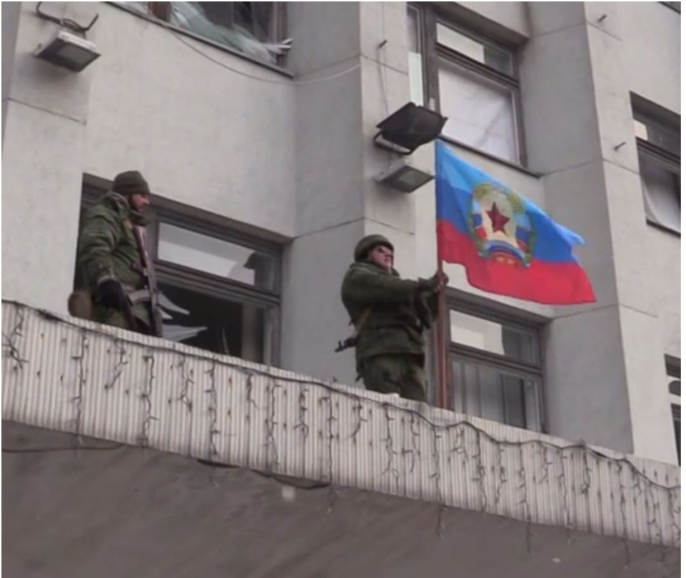
Vyvěšení vlajky osvoboditelů LLR ve městě Rubežno

Z tohoto projevu jasně vidíte, jak má vypadat pronárodní kádr a prezident. Kroky prezidenta Putina nejsou neomezené, u moci ho drží silové rozestavení lidí, kteří na něm závisí a především Ruský židovský kongres, který potřebuje Ruskou armádu k ochraně svých zájmů a celistvosti Ruska. Je to zvláštní situace, protože Putin není tím kádrem, kterým měl být podle představ Berezovského a Levieva v roce 1999, ale bez Putina by Rusko skončilo a spolu s ním i Ruský židovský kongres a jeho správa nad majetky jednotného Ruska. Je to svazek z rozumu, i když svatba vypadala jinak.