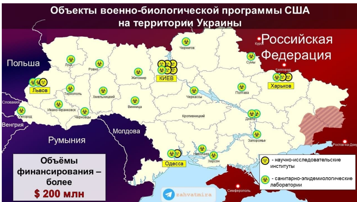
Biologické laboratoře na Ukrajině

V laboratořích na Ukrajině financovaných USA, které minulý týden obsadily ruské jednotky, se prováděly pokusy s netopýřím koronavirem [2] a dalšími nebezpečnými patogeny, prohlásila ve čtvrtek Moskva s odvoláním na dokumenty zabavené v těchto zařízeních. Údajně se plánovalo přejít k viru afrického moru prasat a antraxu. Igor Konašenkov, mluvčí ruského ministerstva obrany, uvedl, že “v biolaboratořích, vytvořených a financovaných USA na Ukrajině, byly prováděny pokusy se vzorky netopýřního koronaviru, jak ukazují dokumenty” . Ruský úředník dále tvrdil, že v roce 2022 hodlaly v laboratořích pracovat na patogenech ptáků, netopýřů, plazů a plánovali přejít k výzkumu, zda tato zvířata mohou přenášet virus afrického moru prasat a antraxu.