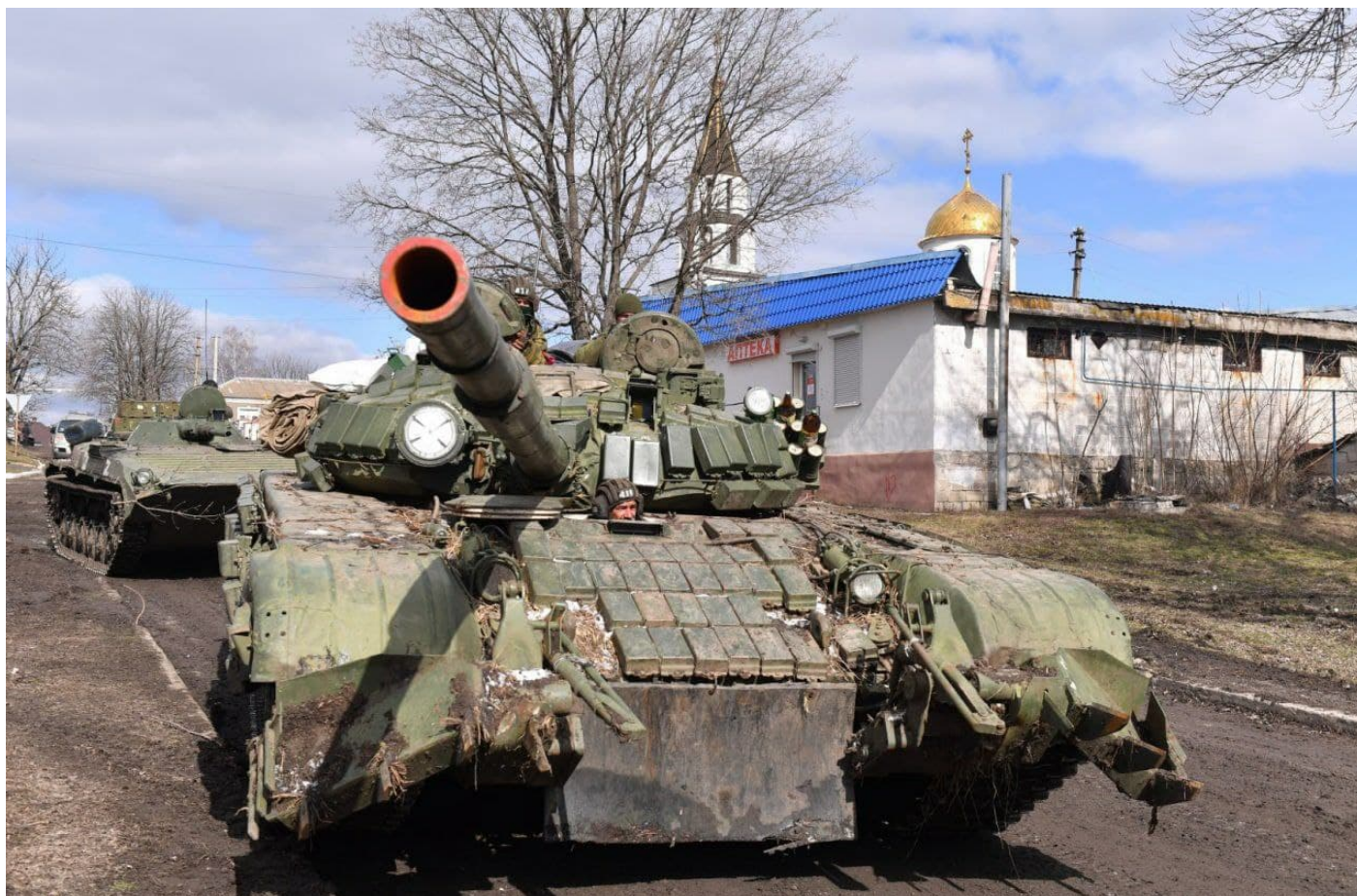
Tank jednotky DLR v oblasti Bugas

Volkssturm proces je velice důležitým materiálem pro studium konceptuálních procesů řízení. Jednalo se totiž o unikátní, nečekaný, ale velice nebezpečný objektivní proces bezstrukturního řízení. Byl to produkt nacifikace německé společnosti, který vznikl zezdola jako bezstrukturní důsledek umocňování hysterie obyvatelstva. A přesně tento Volkssturm proces s naprosto děsivou jistotou teď vidíme nejen mezi českými politiky, ale především obyvatelstvem, které natahuje maskáče a chce jít bojovat na Ukrajinu. A dokonce tento proces Volkssturm postihuje už i premiéra ČR a dokonce i prezidenta Zemana, kteří vyzývají k abolici pro bojovníky z řad Čechů, kteří půjdou bojovat na Ukrajinu za Kyjev.