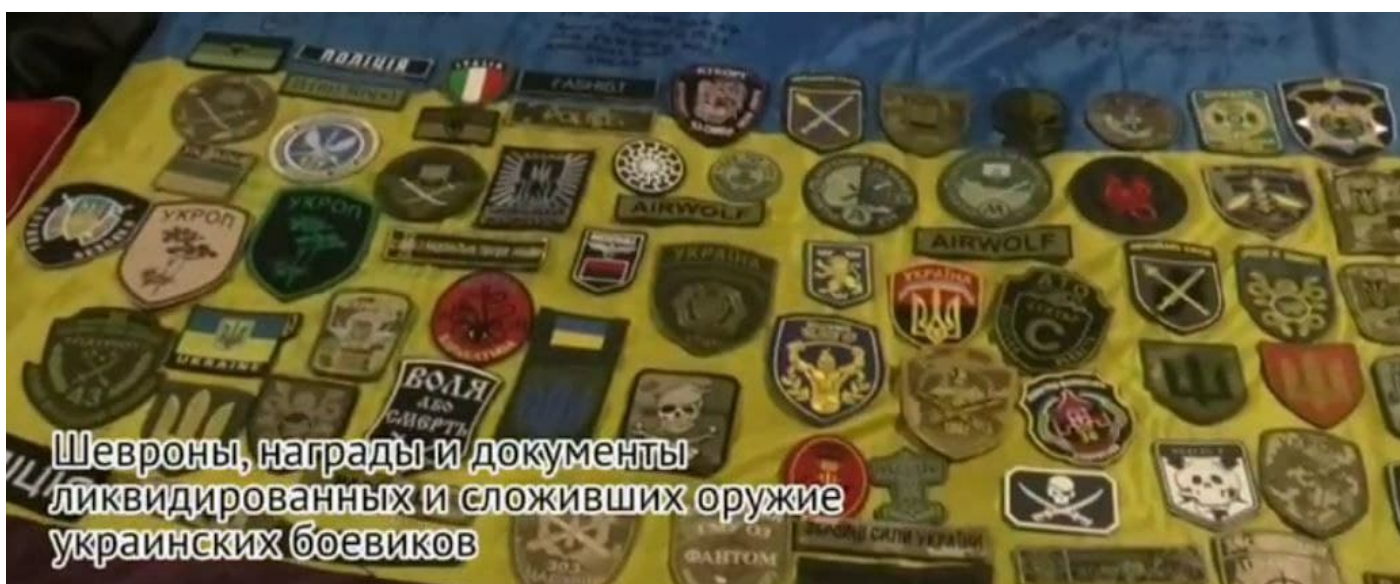
Nášivky zajatých ukrajinských vojáků a žoldáků

Ti totiž žoldákům z ČR slibují beztrestnost a abolicí, pokud teď hned půjdou bojovat na Ukrajinu za Kyjev. Tohoto vývoje se Američané děsí, protože k tomu nemělo dojít. To je nebezpečná situace, kdy cizí žoldáci se státní podporou ze zemí NATO mohou být shledáni jako regulérní vojáci NATO, a v tom okamžiku by se konflikt dostal za hranice Ukrajiny. A v takové situaci nechtějí Američané do války proti Rusku, to nebylo v plánu, protože plánem byla jen izolace Ruska, ne 3. světová válka. Jenže, Američané jsou holt znovu bez konceptuální gramotnosti, éto děbili.