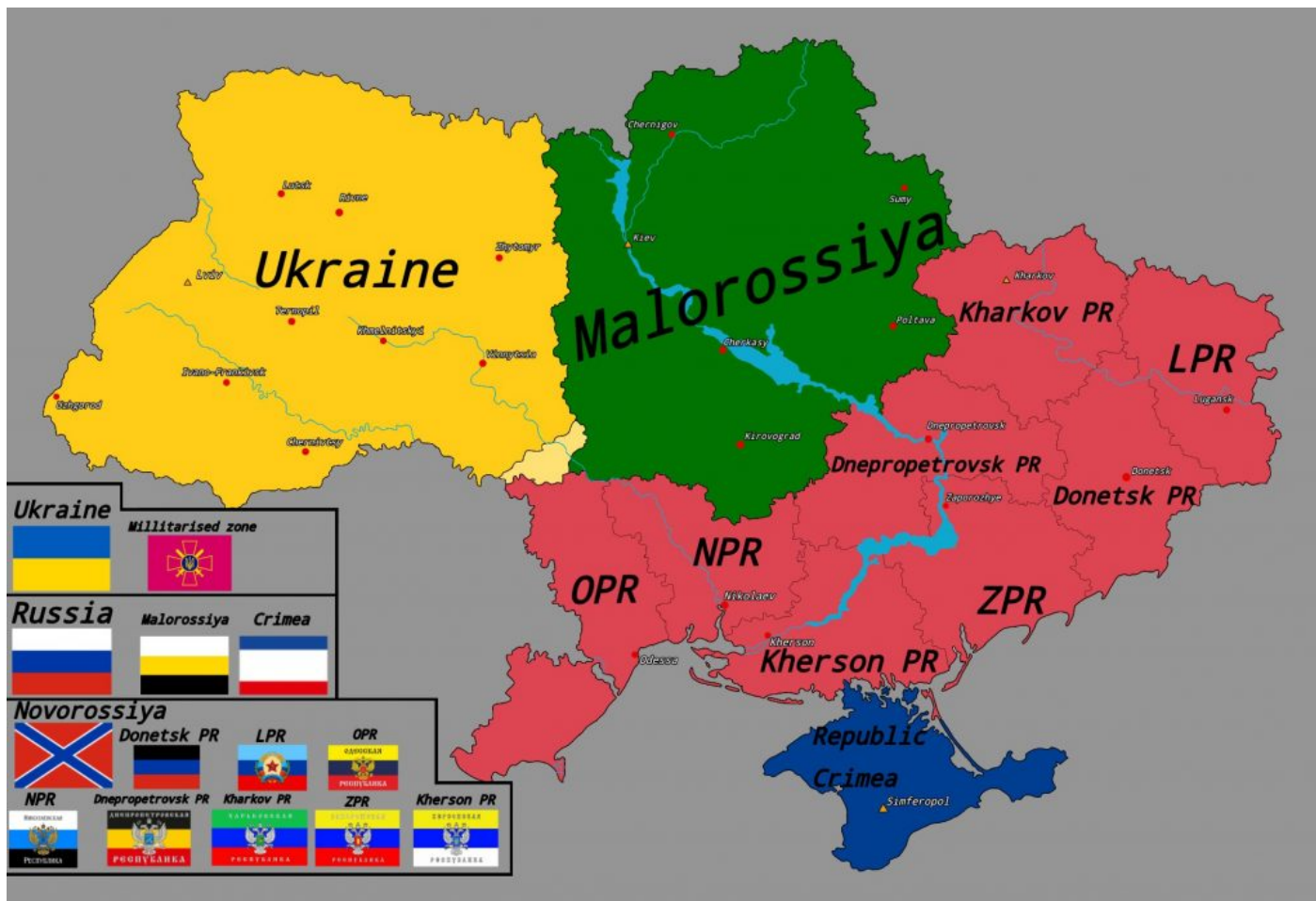
Malá Ukrajina (žlutě) a Nová Ukrajina (zeleně a červeně)

obsadit celou Ukrajinu, potřebuje ale kontrolovat celý prostor na jih a sever od Kyjeva a na východ od Dněpru. Přestože se často používá označení Malorusko pro prostor okolo Kyjeva, podle informací od ruských novinářů Kreml hovoří o červené a zelené oblasti na mapě dohromady jako o Novoukrajíně pod ruskou kontrolou . Zbytek té nacifikované a Banderovské Ukrajiny by zůstal na západě s hlavním městem Lvov. A pozor, důležité!