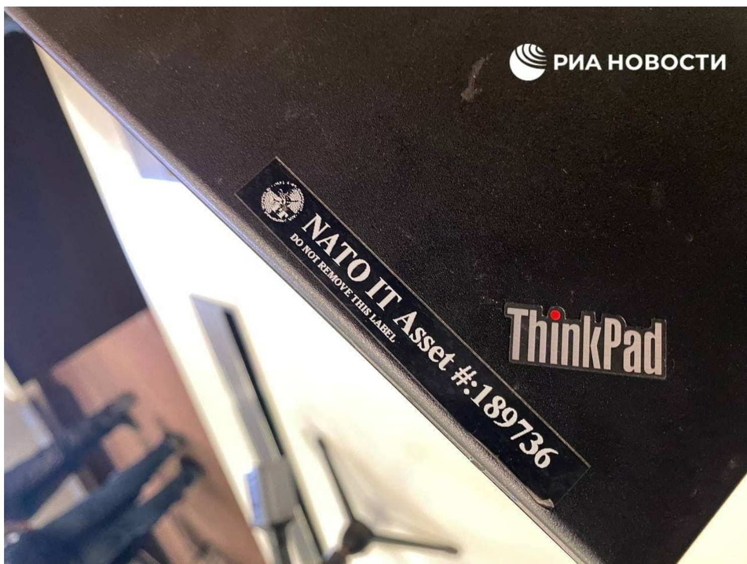
Počítač ThinkPad zkonfiskovaný v obsazené centrále Právého sektoru, detail sériového čísla

Tento počítač tak podle všeho slouží ke komunikaci s americkým letectvem a ministerstvem obrany, které poskytují Pravému sektoru satelitní informace o pohybu ruských vojsk. Přesně k tomuto jsou tyto laptopy používány. Proto nelze zde mluvit o izolovaném konfliktu, NATO se opravdu války na Ukrajině v tichosti účastní, protože poskytuje bojovníkům Právého sektoru informaci o pohybu nepřítele. Ruská armáda otevřela na Ukrajině koridory pro civilní obyvatelstvo, ale na Ukrajinu již přijeli první žoldáci z Velké Británie.