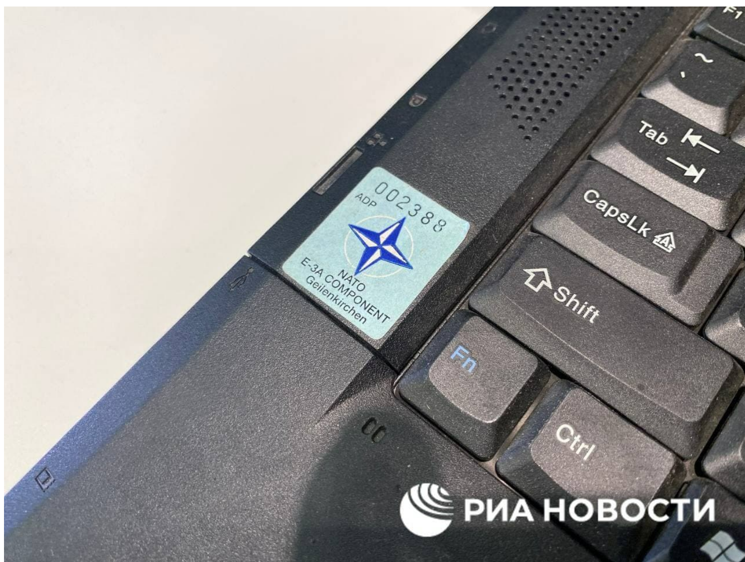
Počítač ThinkPad zkonfiskovaný v obsazené centrále Pravého sektoru, detail útvaru AWACS v Geilenkirchenu

A to ani v případě, že mají za sebou čajové mise v Afghánistánu nebo puďinkové asistence z Iráku poskytované tamní policii. Šílenství Miloše Zemana i Petra Fialy se prohlubuje, jejich pomatenost vyžaduje snad možná už i psychiatrické vyšetření, protože podporovat výjezdy českých občanů do boje na Ukrajině na podporu Banderovců a nacistů, to je opravdu neuvěřitelné chucpe. Nepřítelem Ukrajiny nejsou Rusové, ale junta neonacistů, která se tam v Kyjevě chopila moci v roce 2014. Tohle je potřeba stále opakovat a roztrubovat všude a na všech frontách.