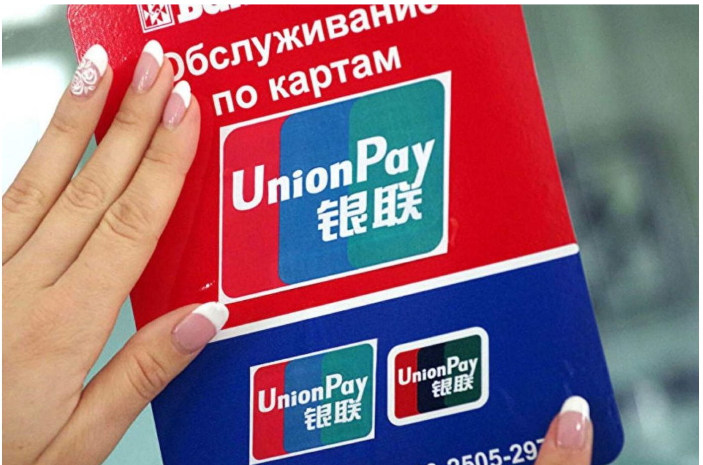
Obchody v Rusku se v neděli začaly připravovat na přijímání karet systému UnionPay

A co víc, podle ruských médií bylo učiněno rozhodnutí, že ruské banky se již k systému SWIFT a k bankovním kartám VISA a Mastercard nevrátí, a to ani v případě, že v budoucnu budou sankce proti Rusku zrušeny. Vladimir Putin již podle ruské televize vyjádřil uspokojení nad krokem ruských bank, že tento krok pomůže snížit závislost ruského bankovního sektoru na západním dolarovém bankovním systému. Tohle je doslova černá neděle pro americký dolar, protože Rusko přijetím čínského UnionPay vytvoří největší platební bezhotovostní síť na světě, pokud jde nejen o počet uživatelů, ale především o objem peněz, které budou systémem protékat. A to není zdaleka všechno.