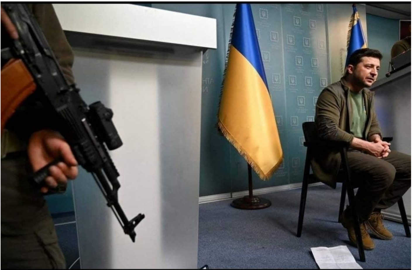
Volodymyr Zelensky v improvizovaném studiu na americkém velvyslanectví ve Varšavě. Hlídá ho jeho vlastní prezidentská ukrajinská ochranka.

Ruská armáda zahájila na Ukrajině v sobotu večer po vypršení příměří pro odsun civilistů mohutnou ofenzívu a na Ukrajině vypukla doslova panika. Podle posledních informací již byla ve Varšavě ustanovena nová polská exilová vláda, jejíž jména musí nejprve projít schválením ve Washingtonu. Podle získaných fotografií z projevů Volodymyra Zelenského se ukazuje, že se nachází na americkém velvyslanectvím ve Varšavě. Potvrzují to malé a nepatrné detaily fotografií, které ukazují, že řečnický stolek, který Zelenský používá, je ten samý pultík, který používá americké velvyslanectví ve Varšavě.