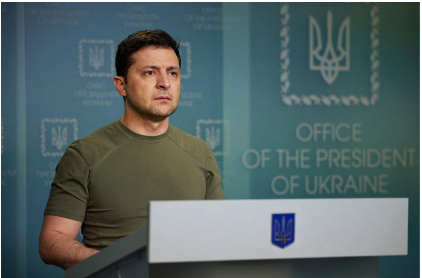
Tady již má pultík nalepené logo Ukrajiny

Podle informací na ruských sociálních sítích je Zelenský ve Varšavě na americkém velvyslanectví kvůli tomu, že po něm jde ruská tajná služba, která operuje ve Varšavě a dopředu počítala s tím, že po zahájení invaze se ukrajinský prezident přesune do Polska. Američané tak vyhodnotili, že ani Polsko není pro Zelenského bezpečné a je proto ukrytý uvnitř na americkém velvyslanectví, kde pro něho zřídili improvizovanou televizní místnost. Do podzemního bunkru v Kyjevě pod prezidentským palácem totiž není zavedena televizní přenosová technika a ani vybavení pro televizní vysílání.