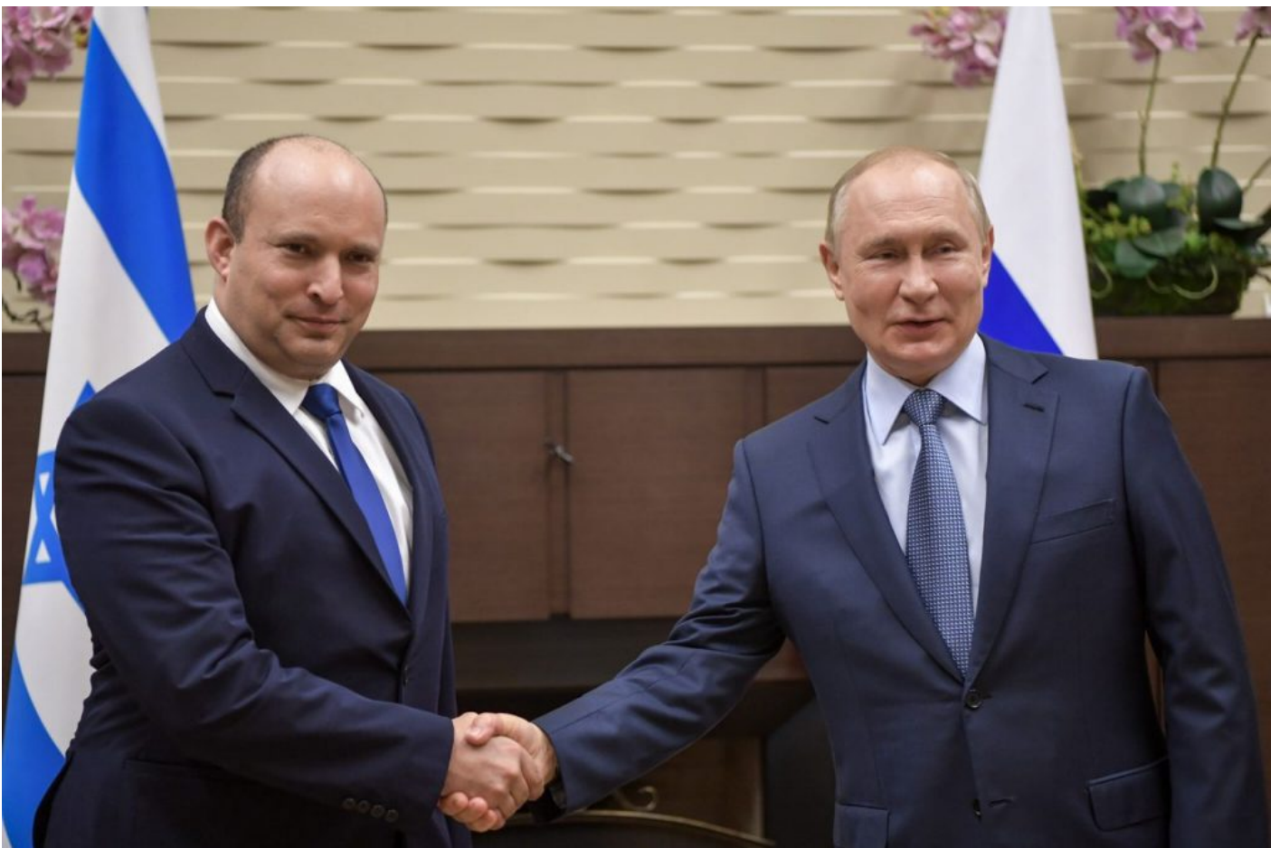
Premiér Izraele Naftali Bennett s Vladimírem Putinem v Moskvě

Taková je pravda o válce na Ukrajině. A kdokoliv z českých politiků vám tvrdí opak, tak vám nehorázně lže. A jestli si čeští politici myslí, že sankce na Rusko něco změní, tak jsou zase úplně mimo jako už v roce 2014. Kreml se snažil 8 let přimět ruské banky pod kontrolou Ruského židovského kongresu (RŽK) k odchodu od amerického dolaru, tedy k projektu de-dolarizace Ruska. Pamatujete, jak se o tom od roku 2014 neustále hovořilo v ruských médiích? Jenže židovské ruské banky ne ne, těm se nechtělo. Ani náhodou! Takže, jak to Kreml zařídil? Provedl invazi na Ukrajinu a kompletně všechny ruské banky byly odříznuty od dolarového SWIFTu a šmitec! V Izraeli je z toho Boží dopuštění a premiér Naftali Bennett hned odletěl do Moskvy. Odchod Ruska od dolaru a přechod k čínskému UnionPay je šokem pro Tel Aviv.