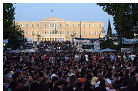
Protesty v Řecku během dluhové krize

Dluhovou krizi v Řecku se však nepodařilo zastavit, pokračovala i v následujícím roce 2011. V důsledku krize pod tlakem řecké i mezinárodní veřejnosti i své vlastní politické strany v listopadu 2011 odstoupil premiér Jorgos Papandreu , nahradil jej Lukas Papadimos , který v době, kdy řecká vláda ve spolupráci s bankou Goldman Sachs prováděla kontroverzní transakce a falšovala statistiky k zamaskování skutečné výše státního dluhu, zastával post guvernéra Řecké centrální banky (1994–2002) a měl tedy na finanční situaci Řecka nezanedbatelný podíl. [zdroj?]