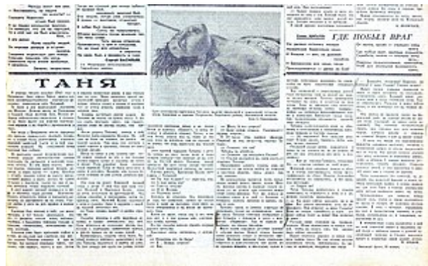
Esej Tanja , noviny Pravda , 27. ledna 1942

Zoju fotografoval Strunnikov v detailu, ležela ve sněhu se skloněnou hlavou, kolem krku měla kousek provazu a holou hrud'. Odborníci berou na vědomí vysoké umělecké přednosti Strunnikovovy práce a zvažují obraz v kontextu překonávání tabu a poukazují na ambivalenci obrazu vytvořeného fotografem.