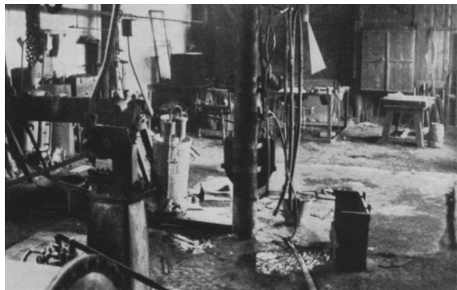
Prázdna továrna při velké hospodářské krizi v Československu

Ekonomické důsledky 1. světové války byly velké a jejich odstraňování bylo dlouhodobou záležitostí. Evropský průmysl se během války přeorientoval téměř výhradně na zbrojní výrobu. Nedostatek financí způsobil velkou zadluženost vítězných mocností u USA .