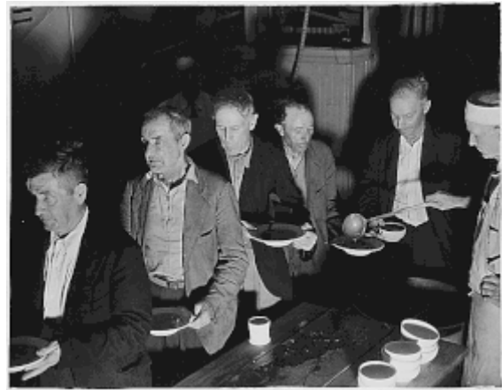
Polévka pro nezaměstnané – USA

Hospodyně dávaly běžně sendviče před domovní dveře, na newyorském nádraží se vkládala do košů zelenina, kterou občané vypěstovali na zahrádkách. Nebylo neobvyklé zaklepat na dveře a požádat o zbytky jídla. [12]