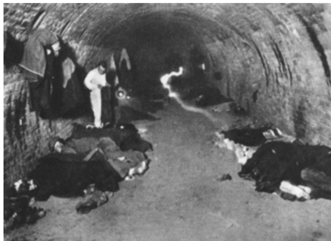
Nezaměstnaní přespávají v cihelně – obrázek z ČSR

Rostoucí inflace (v Německu se hovoří o tzv. hyperinflaci ) nutila státy k dalšímu zadlužování. Přesto se zdálo, že situaci se podařilo stabilizovat, a některé státy prožívaly ve 20. letech dokonce období konjunktury , což souviselo s návratem k běžné spotřebě, na rozdíl od přidělového válečného systému.