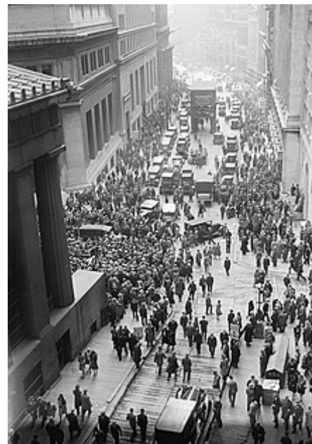
Černý pátek na Wall Streetu

akcionáři paniku a především malí akcionáři, kteří tehdy vlastnili výrazné procento akcií, se pokoušeli prodávat za každou cenu. Ve čtvrtek 24. října 1929 bylo k prodeji nabídnuto přes 12 milionů akcií, o něž nebyl zájem, neboť i v tuto dobu se jich majitelé snažili zbavit za cenu, která byla nadhodnocená. Z tohoto důvodu byla Newyorská burza nucena v pátek 25. října oznámit krach . Tento krach vyvolal krach dalších amerických burz, protože se prodej přesunul na tyto burzy. Tento den bývá označován jako černý pátek a je chápán jako den vypuknutí krize.