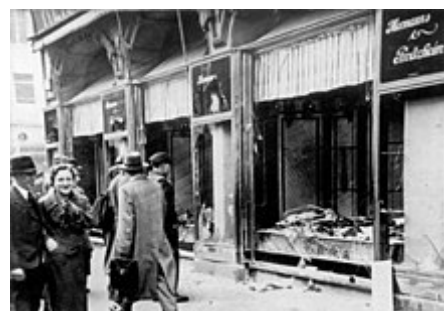
Následky Křišťálové noci - zničená výloha židovského obchodu

Norimberskými zákony bylo postiženo kolem 500 tisíc lidí. 9. listopadu 1938 zinscenovali nacisté „ křišťálovou noc “ – pogrom , během něhož shořelo v Německu značné množství synagog . Příslušníci SS přítom před zraky nečinné policie zavraždili mnoho Židů.