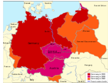
Územní expanze mezi lety 1933 až 1943

Dne 22. června 1941 zaútočilo Německo na Sovětský svaz . Po několika měsících tohoto mohutného tažení padlo do německých rukou celé západní Rusko,