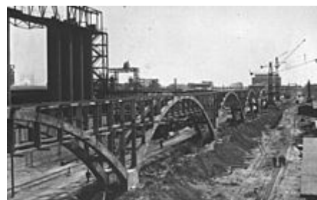
Závod firmy IG Farben na výrobu syntetického oleje ve výstavbě v Buna Werke (1941). Továrna byla součástí komplexu v koncentračním táboře Osvětim.

vedlo k rozčarování z režimu již v roce 1934. [92]