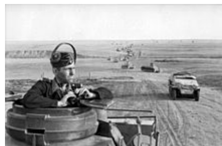
Kolona tanků a dalších obrněných vozidel Panzerwaffe poblíž Stalingradu, 1942

Sjednocené německé ozbrojené síly se v letech 1935 až 1945 nazývaly Wehrmacht (obrněné síly). Zahrnovaly Heer (armáda), Kriegsmarine (námořnictvo) a Luftwaffe (letectvo). Od 2. srpna 1934 byli příslušníci ozbrojených sil povinni složit přísahu bezpodmínečné poslušnosti Hitlerovi osobně. Na rozdíl od předchozí přísahy, která vyžadovala věrnost ústavě země a jejím zákonným ustanovením, tato nová přísaha vyžadovala, aby členové armády poslouchali Hitlera, i kdy by jim bylo nařízeno něco nezákonného. [76] Hitler rozhodl, že armáda bude muset tolerovat a dokonce nabídnout logistickou podporu jednotkám Einsatzgruppen - mobilním komandům smrti odpovědným za miliony úmrtí ve východní Evropě - bude-li to takticky možné. [77] Jednotky Wehrmachtu se také přímo účastnily holocaustu střílením civilistů nebo pácháním genocidy pod rouškou protipartizánských operací. [78] Strana prohlašovala, že Židé byli podněcovateli partyzánského boje, a proto je třeba je eliminovat. [79]