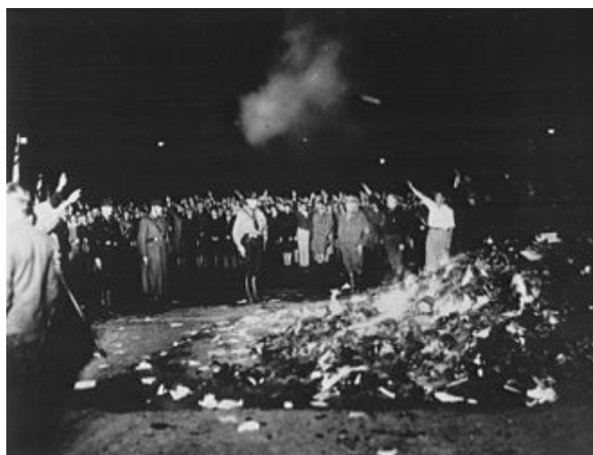
Nacistické pálení knih 10. května 1933 v Berlíně, páleny byly knihy židovských a levicových autorů [260]

Noviny, stejně jako jiná média, byly kontrolovány státem; Říšská tisková komora zavřela nebo koupila noviny a nakladatelství. Do roku 1939 byly více než dvě třetiny novin a časopisů přímo vlastněny ministerstvem propagandy. [261] Denník nacistické strany, Völkischer Beobachter („Lidový pozorovatel“), redigovaný Alfredem Rosenbergem , autorem knihy Mýtus 20. století o rasových teoriích zastávající severskou nadřazenost. [262] Goebbels kontroloval tiskové agentury a trval na tom, aby všechny noviny v Německu zveřejňovaly pouze obsah příznivý pro režim. Pod jeho vedením vydalo ministerstvo propagandy každý týden dvě desítky směrnic o tom, jaké novinky by měly být zveřejněny a jaké úhly pohledu použít; noviny typicky pečlivě dodržovaly směrnice, zejména pokud jde o to,