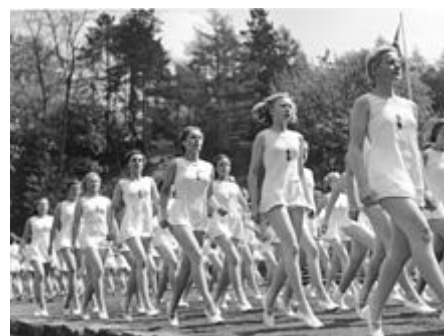
Mladé ženy ze Svazu německých dívek cvičí v roce 1941 gymnastiku

Ženy byly povzbuzovány, aby opustily pracovní místa a tvorba početných rodin s rasově vhodnými ženami byla hlásána propagandistickou kampaní. Ženy získaly bronzovou cenu - známou jako Čestný kříž německé matky ( Ehrenkreuz der Deutschen Mutter ) - za narození čtyři děti, stříbro za šest a zlato za osm a více. [217] Velké rodiny dostávaly dotace na pomoc s výdaji. Ačkoli opatření vedla ke zvýšení porodnosti, počet rodin se čtyřmi a více dětmi mezi lety 1935 a 1940 poklesl o pět procent. [220] Odstranění žen z pracovních míst nemělo zamýšlený účinek uvolnění pracovních míst pro muže, protože ženy byly z velké části zaměstnány jako domácí služebnice, tkalkyně nebo v potravinářském a nápojovém průmyslu - práce, o