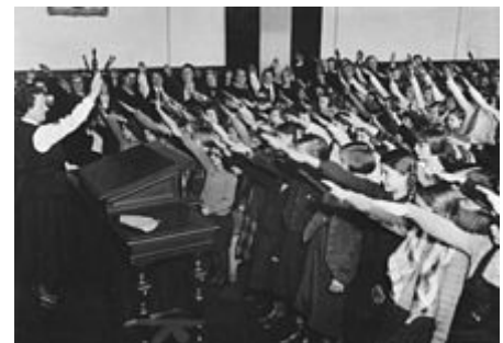
Nacistický pozdrav ve škole (1934); děti byly indoktrinovány v raném věku.

Učitelé museli přísahat věrnost a poslušnost Hitlerovi a ti, kteří nedokázali prokázat dostatečnou shodu s ideály strany, byli často hlášeni studenty nebo kolegy učiteli a byli propuštěni. [201][202] Nedostatek finančních prostředků na platy vedl k tomu, že mnoho