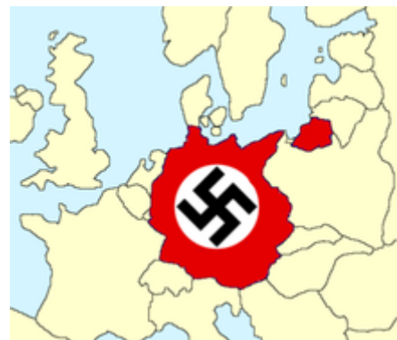
Rozsah Německa před druhou světovou válkou

rozpoutání války a jako následcích za toto rozpoutání o trvalé ztrátě či demilitarizaci některých území, [8][9] nutnost platit reparace v penězích a ve zboží a příkazu na redukci německé armády. Mezi další příčiny nárůstu popularity nacistické ideologie patřily nárůst nacionalismu v německé populaci a myšlenky na vybudování „Velkoněmecké říše“, která měla trvat tisíc let, občanské nepokoje a komunistické puče , hyperinflace ve Výmarské republice , celosvětová hospodářská krize probíhající ve 30. letech 20. století a nárůst síly komunismu v Německu. Všechny tyto důsledky vedly k tomu, že voliči frustrovaní prací politických stran začali stále více volit strany na levém či pravém okraji politického spektra – extrémisty, zejména nacistickou stranu Německa.