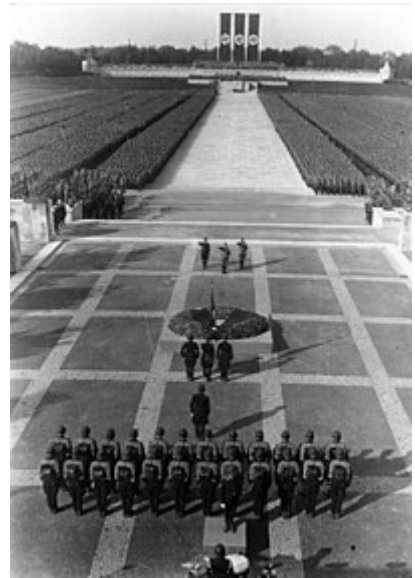
Heinrich Himmler , Hitler a Viktor Lutze provádí nacistický pozdrav na sjezdu v Norimberku, září 1934