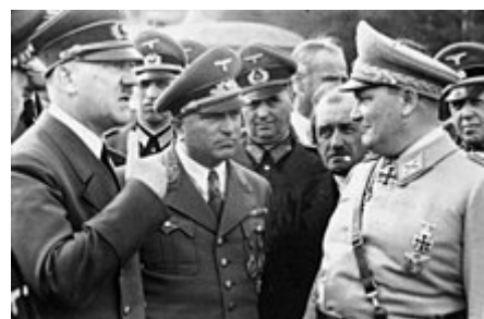
Zleva: Hitler; Robert Ley , šéf německé pracovní fronty; zbrojařský průmyslník Ferdinand Porsche a Hermann Göring, vedoucí čtyřletého plánu (1942)

Když se nacisté v roce 1933 chopili moci, bylo šest milionů nezaměstnaných a do roku 1937 jich bylo méně než milion. [102] Částečně to bylo způsobeno vyjmutím žen z pracovních sil. [103] Reálné mzdy mezi lety 1933 a 1938 poklesly o 25 procent. [91] Po rozpuštění odborů v květnu 1933 byly jejich finanční prostředky zabaveny a jejich vedení zatčeno, [33] včetně těch, kteří se pokoušeli s nacisty spolupracovat. [104] Vznikla nová organizace Německá pracovní fronta (Deutsche Arbeitsfront) pod funkciónářem nacistické strany Robertem Leyem . [105] Průměrný pracovní týden byl v roce 1933 43 hodin; do roku 1939 se zvýšil na 47 hodin. [106]