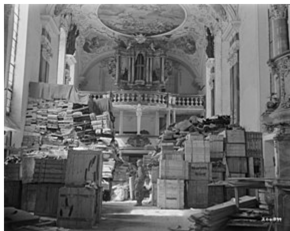
Německá kořist uložená v Schlosskirche v Ellingenu , Bavorsko (duben 1945)

V průběhu války nacisté z okupované Evropy vytěžili značnou kořist. Historik a válečný zpravodaj William L. Shirer píše: „Celkové množství [nacistické] kořisti nebude nikdy známo; ukázalo se, že je nad schopnost člověka jej přesně spočítat.“ [135] Rezervy zlata a další zahraniční podíly byly národním bankám okupovaných národů zabaveny, zatímco obvykle byly ukládány jako velké „okupační náklady“. Na konci války byly nacistické náklady vyčísleny na 60 miliard říšských marek, přičemž samotná Francie zaplatila 31,5 miliardy. Francouzská centrální banka byla nucena poskytnout 4,5 miliardy říšských marek v „úvěrech“ Německu, zatímco dalších 500 000 říšských marek bylo hodnoceno nacisty přes Vichistickou Francii ve formě „poplatků“ a dalších různých naúčtování. Nacisté podobným způsobem vykořisťovali další dobyté národy. Po válce dospěl United States Strategic Bombing Survey k závěru, že Německo získalo 104 miliard říšských marek v podobě okupačních nákladů a dalších převodů bohatství z okupované Evropy, včetně dvou třetin hrubého domácího produktu Belgie a Nizozemska . [135]