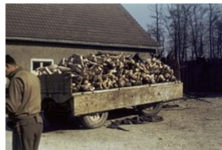
Valník plný mrtvol v koncentračním táboře Buchenwald po osvobození americkou armádou, 1945

židovského obyvatelstva v Evropě - jedenácti milionů lidí. Někteří se upracovali k smrti a zbytek byl zabit při implementaci konečného řešení židovské otázky . [182] Zpočátku byly oběti zabíjeny střelnými zbraněmi jednotkami Einsatzgruppen , poté plynovými komorami nebo plynovými dodávkami , ale tyto metody se ukázaly v tomto rozsahu nepraktické. [183][184] V roce 1942 byly zřízeny vyhlazovací tábory vybavené plynovými komorami v Osvětimi , Chełmnu , Sobiboru , Treblince a dalších místech. [185] Celkový počet zavražděných Židů se odhaduje na 5,5 až 6 milionů [186] včetně více než milionu dětí. [187]