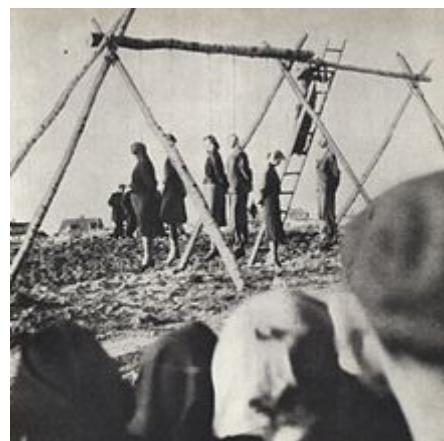
Veřejná poprava 54 Poláků v Rožkách, Mazovském vojvodství (poblíž Radomu ), Německem okupované Polsko, 1942

Oblasti pod německou správou zahrnovaly Protektorát Čechy a Morava , Říšský komisariát Ostland (zahrnující pobaltské státy a Bělorusko) a Říšský komisariát Ukrajina . Dobyté oblasti Belgie a Francie byly pod kontrolou vojenské správy Belgie a severní Francie . [27] Belgická oblast Eupen a Malmedy , která byla součástí Německa až do roku 1919, byla opět připojena. Část Polska byla začleněna do říše a v okupovaném středním Polsku byl zřízen Generální gouvernement [28] Vlády Dánska, Norska ( Říšský komisariát Norsko ) a Nizozemska ( Říšský komisariát Nizozemsko ) byly podřízeny civilním správám, které tvořili převážně domorodci. [27] Hitler měl v úmyslu mnoho z těchto oblastí začlenit do říše. [29] Od roku 1943 Německo okupovalo italský protektorát v Albánii a italský governorát Černou Horu [30] a v okupovaném Srbsku v roce 1941 instalovalo loutkovou vládu . [31]