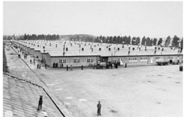
Vězeňská kasárna v koncentračním táboře Dachau, kde nacisté v roce 1940 zřídili vyhrazená kasárna pro duchovní odpůrce režimu [251]

Ovšem v nacistickém Německu byla velmi rychle stanovena jasná hranice mezi církevními záležitostmi, do nichž se nemá plést stát, a záležitostmi státu, do nichž se nemají plést církve. Dne 20. července 1933 uzavřelo nacistické Německo konkordát se Svatým stolcem . I přes uzavření konkordátu postupovali nacisté vůči katolické církvi tvrdě – katolický tisk byl cenzurován , úřady měly právo nepovolit procesí nebo uzavřít klášterní školy . Papež Pius XI. na tuto situaci zareagoval encyklikou S palčivou starostí , jejíž šíření nacisté v Německu zakázali. Encyklika