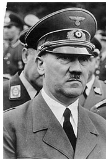
Nacistický Vůdce Adolf Hitler na fotografii z roku 1937

Velkým problémem pro Hitlera byla SA , paramilitární organizace NSDAP. Vůdce SA Ernst Röhm toužil začlenit své muže do řad reichswehru a stát se jeho velitelem. To ovšem narušovalo Hitlerovy záměry a naráželo na odpor průmyslníků, kteří Hitlera podporovali.