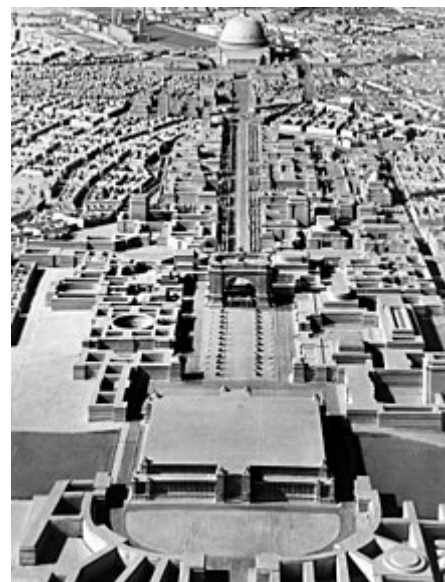
Plány Berlína si žádaly vybudování Volkshalle (Lidového sálu) a vítězného oblouku na koncích širokého bulváru.

Skladatel Richard Strauss byl jmenován prezidentem Reichsmusikkammer (říšské hudební komory) při jejím založení v listopadu 1933. [276] Jak tomu bylo u jiných uměleckých forem, nacisté ostrakizovali hudebníky, kteří byli považováni za rasově nepřijatelné a většinou nesouhlasili s příliš moderní nebo atonální hudbou. [277] Jazz byl považován za obzvláště nevhodný a zahraniční jazzoví hudebníci opustili zemi nebo byli vyhoštěni. [278] Hitler upřednostňoval hudbu Richarda Wagnera , zejména skladby založené na germánských mýtech a hrdinských příbězích, a od roku 1933 do roku 1942 se každoročně účastnil festivalu v Bayreuthu. [279]