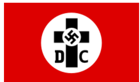
Vlajka hnutí Německých křesťanů ( Deutsche Christen ), 1934