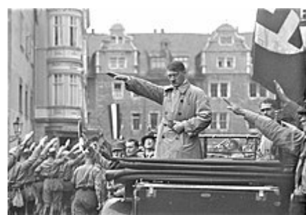
Adolf Hitler a Rudolf Hess ve Výmaru na fotografii z roku 1930

poslaneckých mandátů a NSDAP se stala druhou nejsilnější stranou v Reichstagu . V červenci 1932 se konaly další spolkové volby, ve kterých nacisté získali 230 křesel, čímž se stali nejpočetnější politickou stranou působící v Reichstagu. [12] Prezident Hindenburg se zdráhal předat moc do rukou Hitlera, nicméně dřívější kancléř Franz von Papen uzavřel s Hitlerem dohodu mezi NSDAP a DNVP , která umožnila Hitlerovi stát se říšským kancléřem. Dne 30. ledna 1933 jmenoval Hindenburg Hitlera kancléřem Německa poté, co skončila neúspěchem snaha generála Kurta von Schleichera o vytvoření stabilní vlády. Hitler začal na Hindenburga vyvíjet nátlak prostřednictvím jeho syna Oskara von Hindenburga a intrik s Papenem, který sledoval vlastní zájmy. Von Papen předpokládal, že z