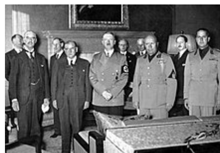
Zleva: Chamberlain , Daladier , Hitler, Mussolini a Ciano před podepsáním Mnichovské dohody .