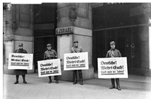
Nacistický bojkot židovských podniků, duben 1933. Na plakátech je uvedeno: „Němci! Braňte se! Nekupujte od Židů!“

Diskriminace Židů začala okamžitě po uchopení moci. Po měsíční sérii útoků členů SA na židovské podniky a synagogy vyhlásil Hitler 1. dubna 1933 národní bojkot židovských podniků. [143] Zákon o obnovení úřednictva ( Gesetz zur Wiederherstellung des Berufsbeamtentums ), který byl přijat 7. dubna, přinutil všechny neárijské státní zaměstnance, aby odešli z právnické profese a státní služby. [144] Podobná legislativa brzy připravila ostatní židovské profesionály o právo praktikovat a dne 11. dubna byl vyhlášen výnos, který stanovil, že každý, kdo má dokonce jen jednoho židovského rodiče nebo prarodiče, je považován za neárijsce. [145] V rámci snahy o odstranění židovského vlivu z kulturního života členové německého Spolku nacionálně socialistických studentů odstranili z knihoven všechny knihy považované za jiné než německé a 10. května se konalo celostátní pálení knih . [146]