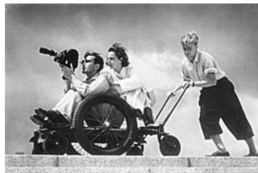
Leni Riefenstahlová (za kameramanem) na olympiádě v roce 1936

ministerstvo propagandy, které do roku 1939 produkovalo většinu německých filmů. Produkce nebyly vždy zjevně propagandistické, ale obecně měly politický podtext a sledovaly stranické linie týkající se témat a obsahu. Skripty byly předem cenzurovány. [281]