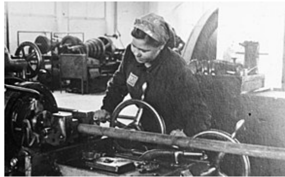
Dělnice s nášivkou Ostarbeiter v továrně IG Farben v Osvětimi