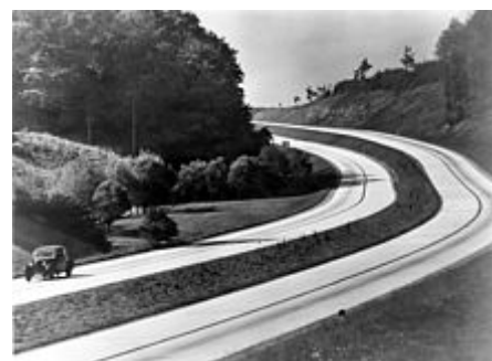
Dálnice ve 30. letech

Mezi hlavní projekty veřejných prací financované z deficitních výdajů patřilo vybudování sítě dálnic ( Autobahnen ) a poskytnutí financování programů iniciovaných předchozí vládou na zlepšení bydlení a zemědělství. [97] Ke stimulaci stavebnictví byl poskytnut úvěr soukromým podnikům a byly poskytnuty dotace na nákup a opravy domů. [98] Pod podmínkou, že manželka opustí pracovní místo, mohly mladé páry árijského původu, které se chtěly oženit, získat půjčku až 1 000 říšských marek, a částka, která měla být splacena, byla snížena o 25 procent za každé narozené dítě. [99] Výhrada, že žena musí zůstat mimo domov nezaměstnaná, byla roku 1937 zrušena kvůli nedostatku kvalifikovaných pracovníků. [100]