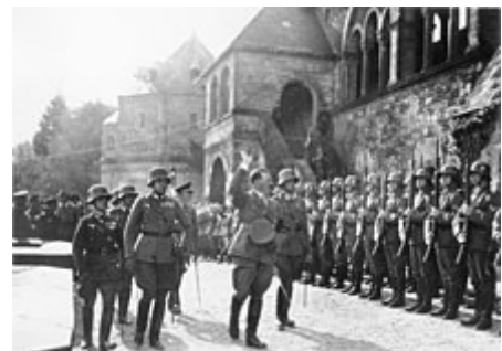
Hitler a Erwin Rommel při přehlídce vojáků v Goslaru roku 1934

Většina vyšších důstojníků reichswehru , kteří prodělali výcvik ještě za dob císařství , se nikdy nesmířila se vznikem Výmarské republiky . Tito důstojníci spatřovali v Hitlerovi obhájce svých zájmů, který opětovně vyzbrojí armádu, zasadí se o revizi Versailleské smlouvy a z Německa znovu vybuduje politickou a vojenskou velmoc. [13] Generální štáb reichswehru si pak Hitler naklonil v červnu 1934, když při nocí dlouhých nožů provedl čistku v SA . Po smrti prezidenta Paula von Hindenburga se stal Hitler hlavou státu a změnil text vojenské přísahy – zatímco do této chvíle přísahali vojáci věrnost národu a vlasti , tak nyní již přísahali věrnost vůdci Německé říše a národa Adolfu Hitlerovi . [14] Před nástupem Hitlera k moci, v roce 1932, měla armáda 44 generálů, v roce 1938 jich bylo 261. [15] 16. března 1935 zavedli nacisté brannou povinnost . Armáda postupně opět získala svou ztracenou prestiž a nacistický režim navíc přikládal armádním záležitostem mimořádnou důležitost. Přesto se na přelomu let 1937 a 1938 objevily v armádě první náznaky opozice vůči režimu. Některé důstojníky znepokojil především Hitlerův plán