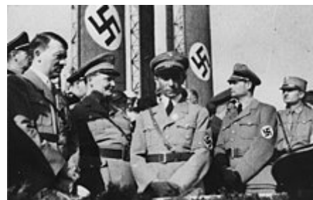
Hitler, Göring, Goebbels a Rudolf Hess během vojenské přehlídky v roce 1933

Zatímco nejvyšší představitelé se hlásili k Hitlerovi a řídili se jeho politikou, měli značnou autonomii. [48] Očekával, že úředníci „budou pracovat směrem k Vůdci“ - převzít iniciativu při prosazování politiky a akcí v souladu s cíli strany a Hitlerovými přáními, aniž by se podílel na každodenním rozhodování. [49] Vláda byla