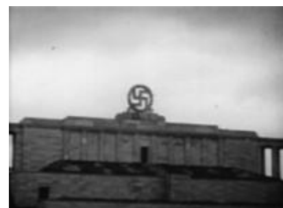
Americká armáda odpaluje svastiku budovy