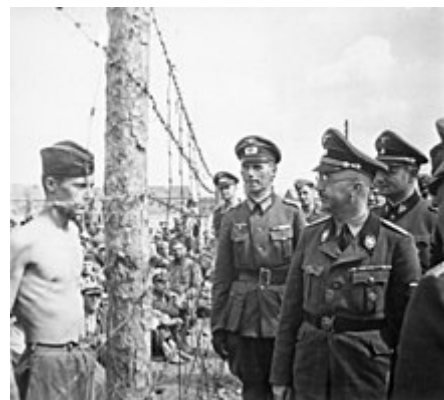
Reichsführer-SS Heinrich Himmler na návštěvě tábora pro sovětské zajatce na podzim 1941.

svých doktorů a zubních lékařů, 26 až 57 procent právníků, 15 až 30 procent učitelů, 30 až 40 procent vědců a univerzitních profesorů a 18 až 28 procent duchovenstva. [193]