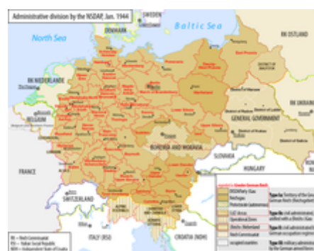
Administrativní mapa Velkoněmecké říše z roku 1944

V důsledku porážky za první světové válce a následné Versailleské smlouvy Německo ztratilo Alsasko-Lotrinsko , severní Šlesvicko a oblast Klaipedy . Sársko se stalo francouzským protektorátem pod podmínkou, že se jeho obyvatelé později v referendu rozhodnou, ke které zemi se připojí, Polsko se stalo samostatnou zemí a přístup k moři získalo díky vytvoření polského koridoru , který oddělil Prusko od zbytku Německa, zatímco Gdaňsk se stal svobodným městem . [20]