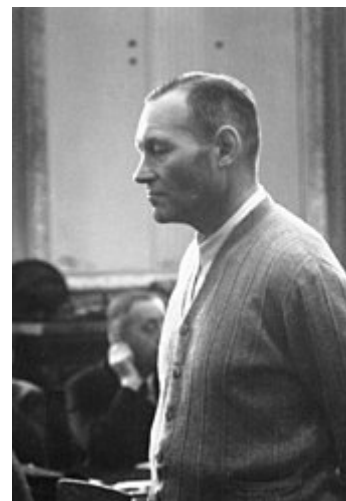
Generál Erich Hoepner před lidovým soudem v roce 1944

Věřili, že Británie půjde do války kvůli Hitlerově plánované invazi do Československa a Německo prohraje. V plánu bylo svrhnout Hitlera nebo ho snad i zavraždit. Mezi účastníky byli generálplukovník Ludwig Beck , generálplukovník Walther von Brauchitsch , generálplukovník Franz Halder , admirál Wilhelm Canaris a generálporučík Erwin von Witzleben , kteří se připojili ke spiknutí v čele s podplukovníkem Hansem Osterem a majorem Helmuthem Groscurthem z Abwehru . Plánovaný převrat byl zrušen po podpisu Mnichovské dohody v září 1938. [68] Mnoho stejných lidí bylo zapojeno do puče plánovaného na rok 1940, ale účastníci opět změnilí názor a ustoupili, částečně kvůli popularitě režimu po počátečních vítězstvích ve válce. [69][70] Pokusy o atentát na Hitlera byly znovu zahájeny v roce 1943, kdy se Henning von Tresckow připojil k Osterově skupině a pokusil se vyhodit do vzduchu Hitlerovo letadlo v roce 1943. Následovalo několik dalších pokusů před neúspěšnou zápletkou z 20. července 1944, což bylo alespoň částečně motivováno rostoucí vyhlídkou na německou porážku ve válce. [71][72] Na spiknutí, které bylo součástí operace Valkýra , se podílel Claus von Stauffenberg , který umístil bombu do konferenční