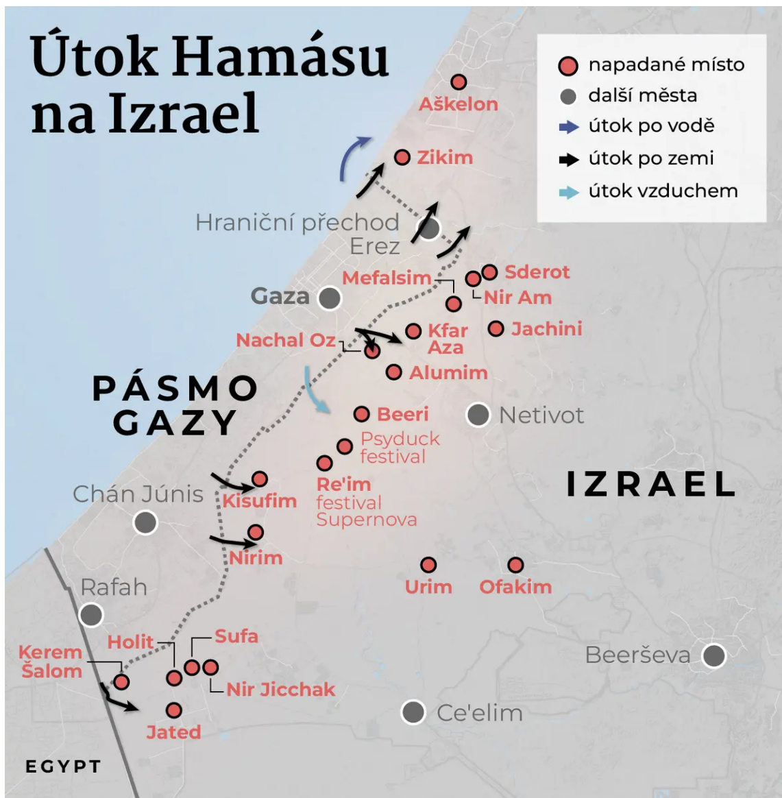
Cíle útoku militantů.