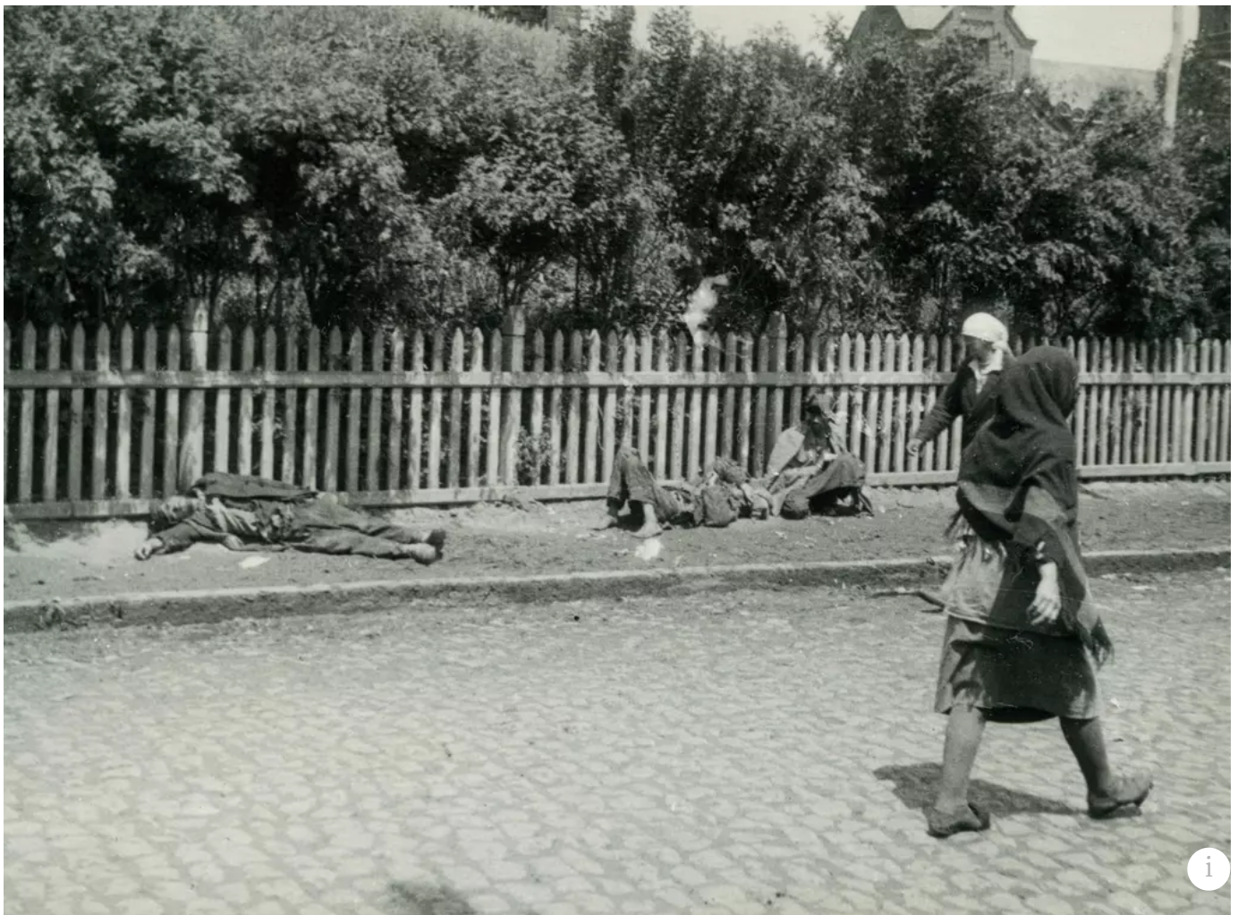
Holodomor. Dobová fotografie z roku 1933 pochází z ulic Charkova.

Neměli šanci. Nesměli se hnout z místa, hlídali je vojáci. Nesměli obchodovat. A za krádež třeba i hrsti zrní z kolchozu hrozil trest smrti.