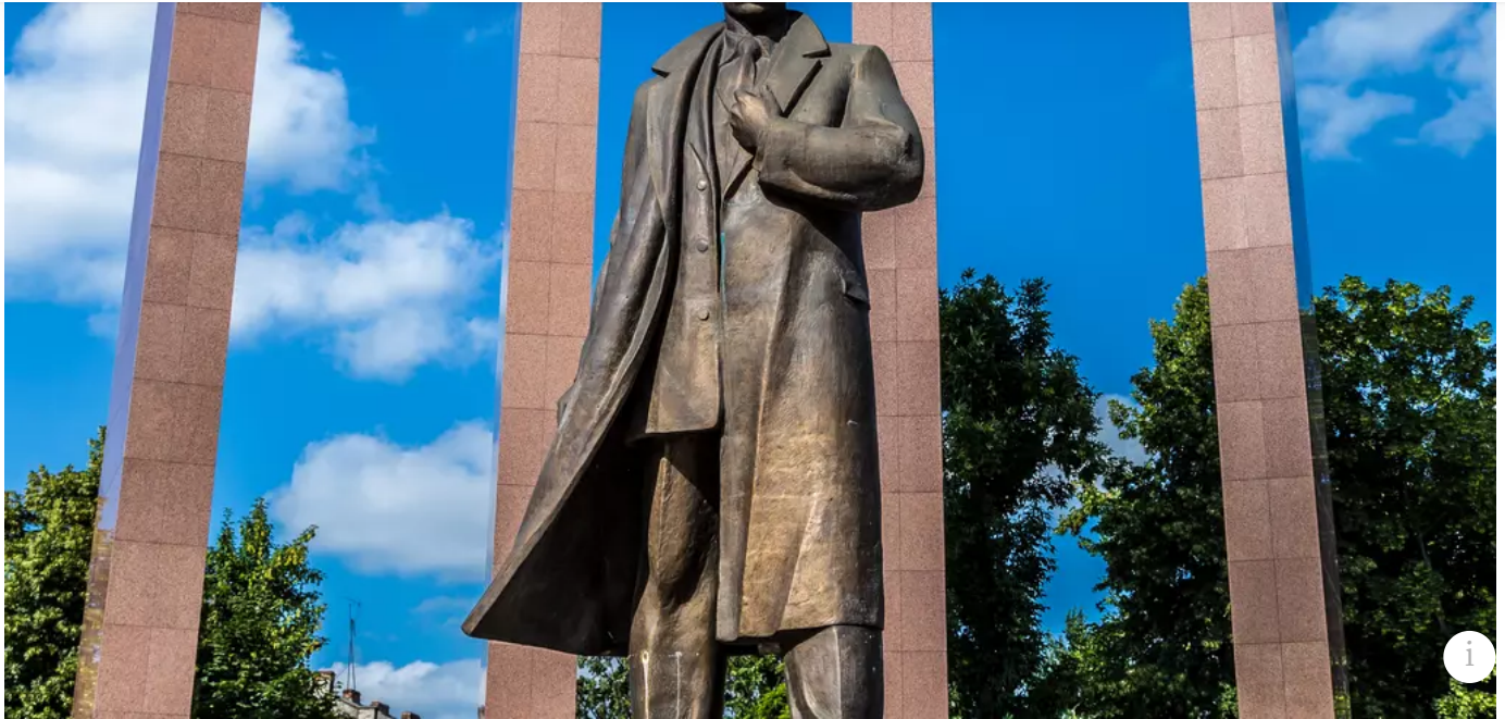
Památník národního ukrajinského hrdiny Stěpana Bandery ve Lvově.