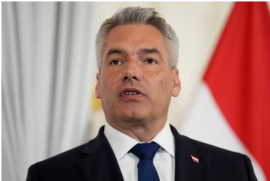
Rakouský kancléř Karl Nehammer