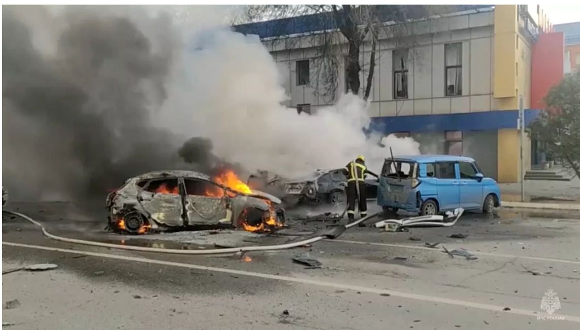
Hasiči likvidují požár aut v ruském Bělgorodu, který podle místních úřadů způsobilo ukrajinské ostřelování města

Ukrajina v sobotu na Bělgorod útočila mimo jiné raketometry Vampire české výroby nebo kazetovou municí, tvrdí ruské ministerstvo obrany. Rusko kvůli ostřelování Bělgorodu požádalo o zasedání Rady bezpečnosti OSN (RB OSN), uvedla podle TASS mluvčí ruské diplomacie Marija Zacharovová s tím, že Moskva žádá, aby se jednání zúčastnila také Česká republika.