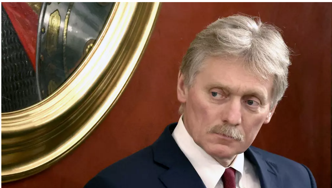
Mluvčí Kremlu Dmitrij Peskov

Moskva zastavila svou účast na dohodě o přepravě ukrajinských zemědělských komodit přes Černé moře. Podle Kremlu nebyly naplněny části týkající se Ruska. Rozhodnutí Moskvy v pondělí oznámil novinářům mluvčí ruského prezidenta Dmitrij Peskov.