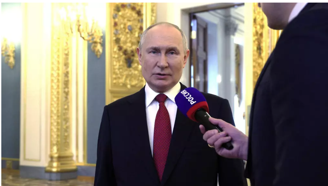
Šéf Kremlu Vladimir Putin při oslavách Dne Ruska.

Přestože ukrajinská strana hlásí po zahájení protiofenzivy jeden úspěch za druhým, ruský prezident Vladimir Putin vidí současnou situaci na Ukrajině naopak. U příležitosti pondělních oslav Dne Ruska mluvil o Rusech jako o lidech, kteří zažívají jedno vítězství za druhým.