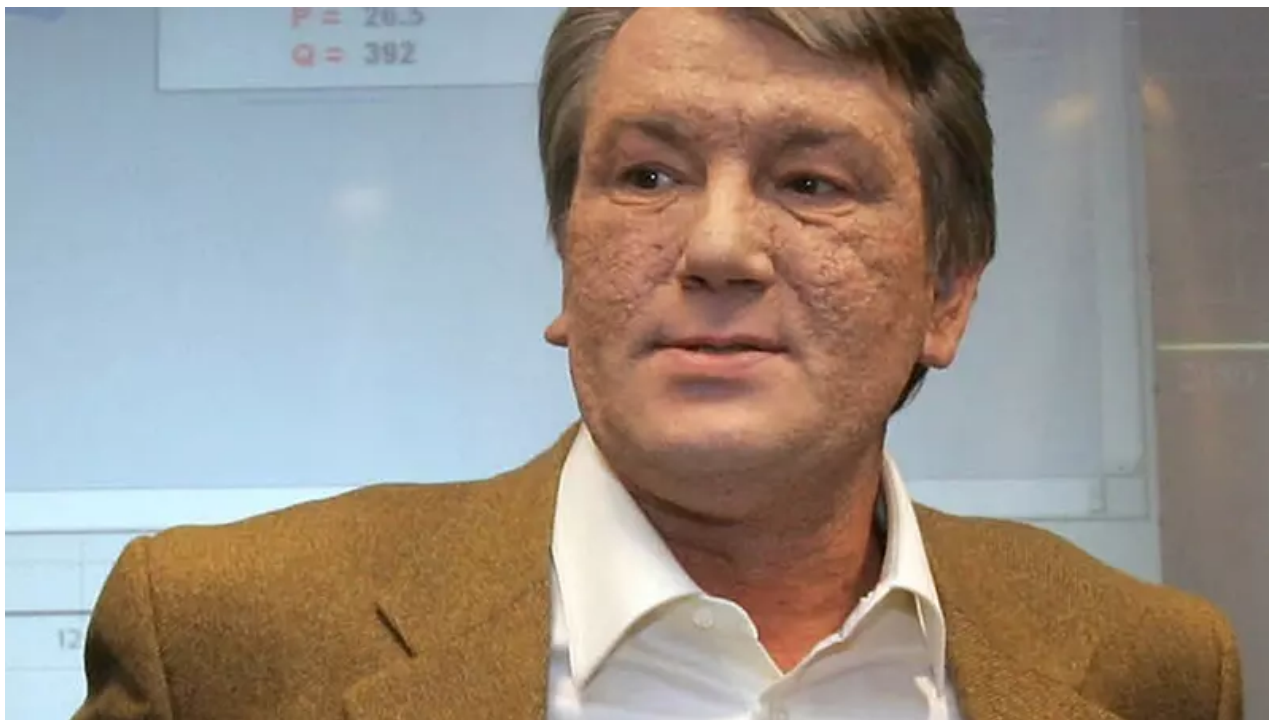
Ukrajinský prezident Viktor Juščenko

Velkou ranou pro ekonomiku bylo, když Rusko začalo požadovat vyšší platby za plyn, které Ukrajina nemohla platit.