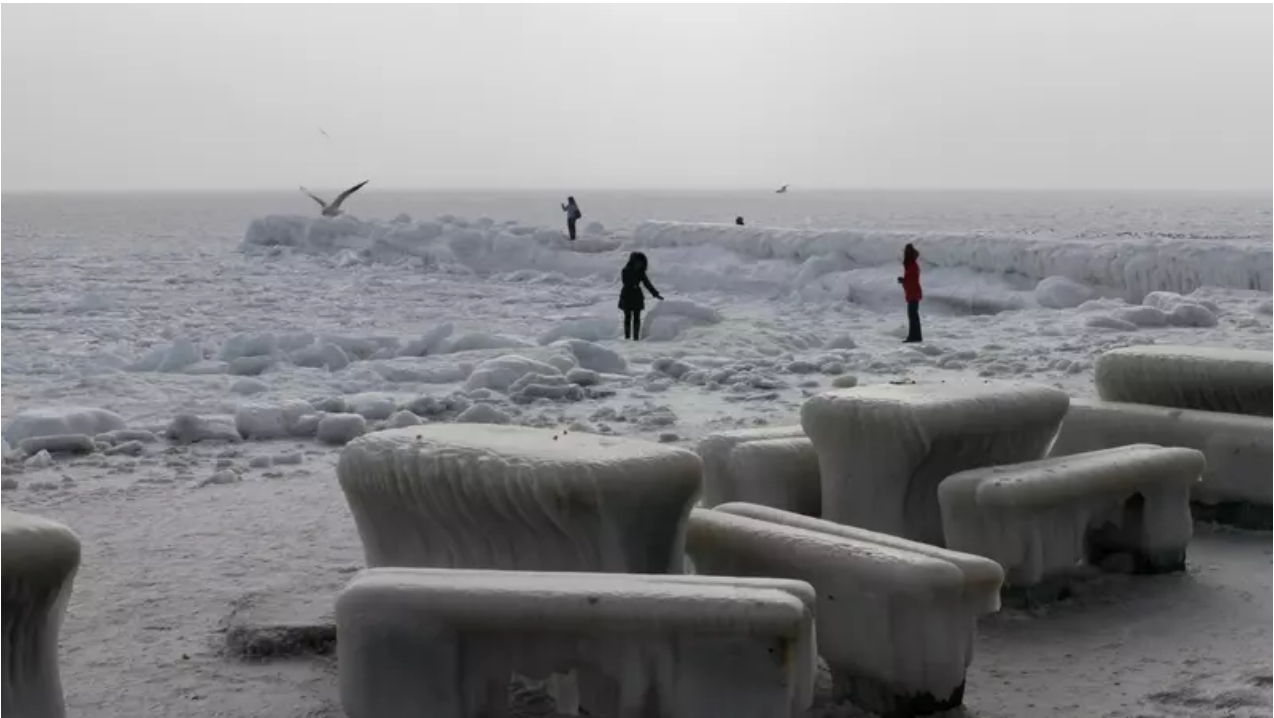
Zamrzlý přístav v Oděse

Hlavním městem je Kyjev s téměř třemi miliony obyvatel, další tři velká města - Charkov, Doněck a Dněpropetrovsk - leží na východě země. Milion obyvatel má ještě přístav Oděsa.