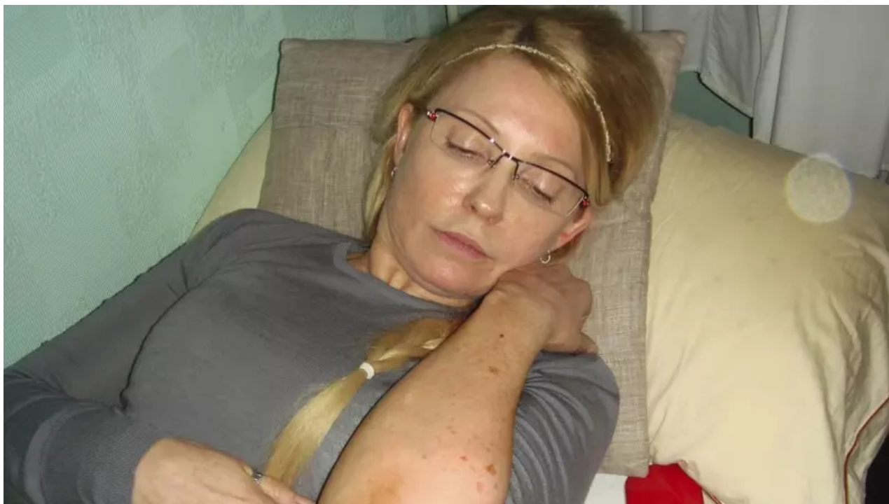
Julija Tymošenkova v charkovské věznici