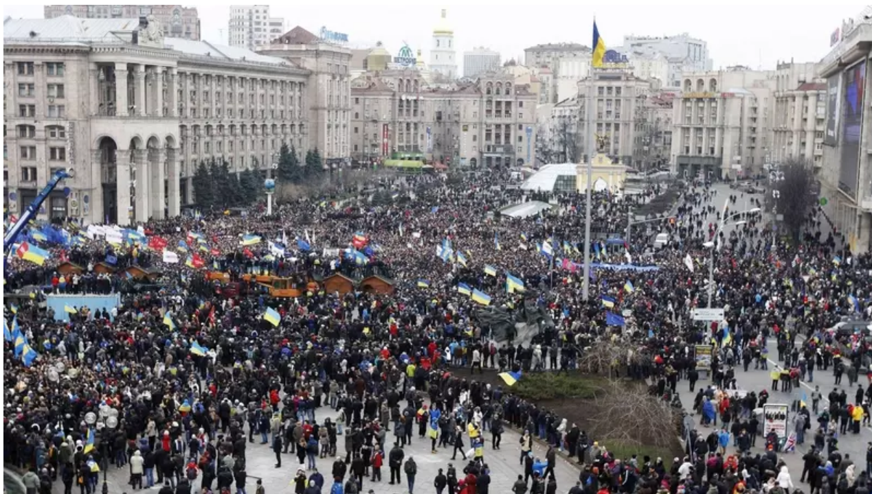
Kyjevské Náměstí nezávislosti při nedělních protestech

Protesty v Kyjevě a dalších částech Ukrajiny ke konci roku 2013 stále více eskalovaly. Ukrajina měla poměrně dobře našlápnuto k podpisu asociační dohody s EU, díky které by se přiblížila západu i členství v EU.