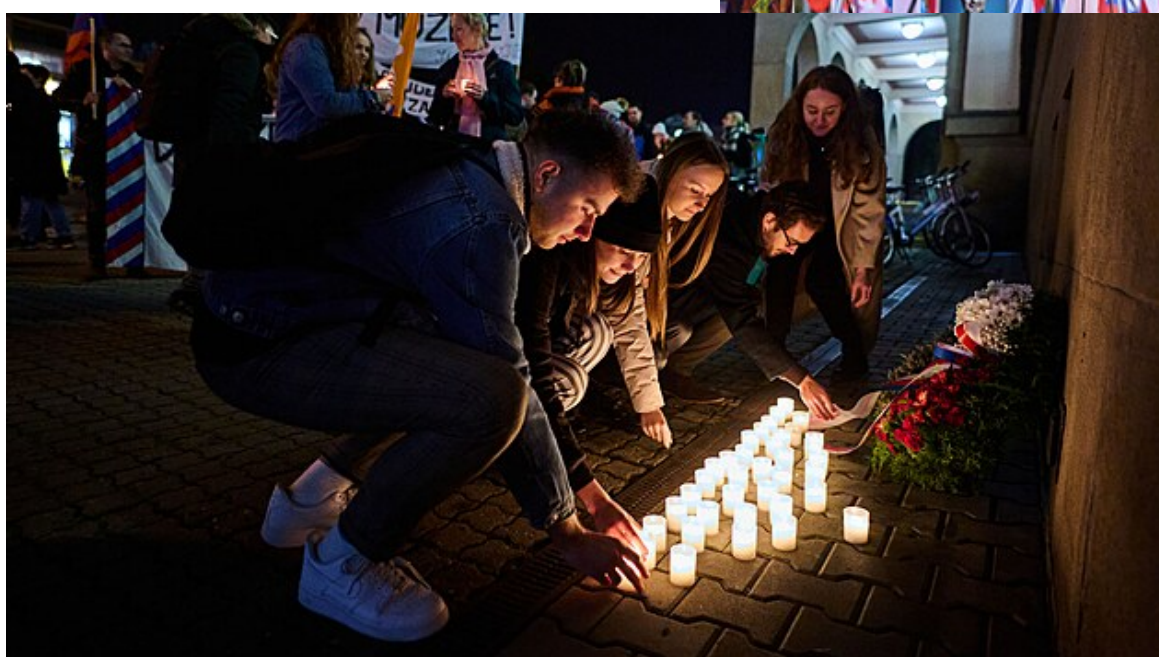
Připomínka dne boje studentů za svobodu ve Zlíně (16. listopadu 2022)

17. listopad si studenti připomínají již dnes ve Zlíně.