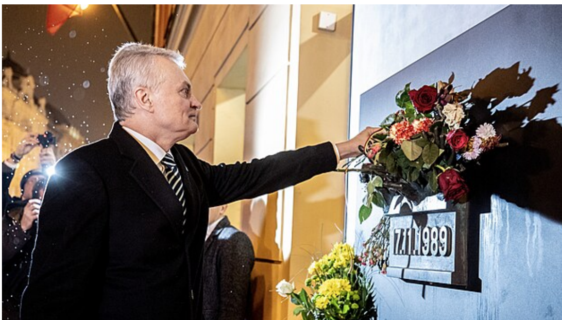
Litevský prezident Gitanas Nauseda položila kytici k památníku na Národní třídě u příležitosti výročí 17. listopadu (16. listopadu)

Litevský prezident Gitanas Nauseda položila kytici k památníku na Národní třídě u příležitosti výročí 17. listopadu.