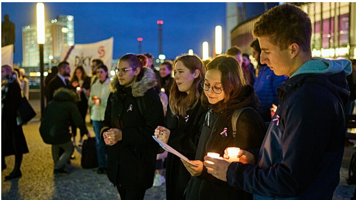
Připomínka dne boje studentů za svobodu ve Zlíně (16. listopadu 2022)