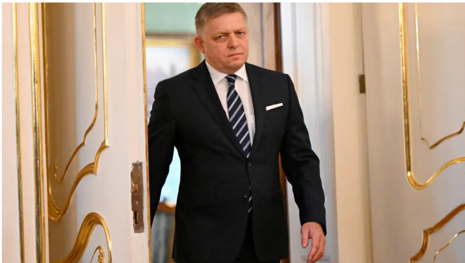
Slovenský premiér Robert Fico

ct24.ceskatelevize.cz/clanek/svet/fico-se-dostal-do-konfliktu-s-britskym-velvyslancem-ten-kritizoval-slovensky-postoj-k-ukrajine-346712