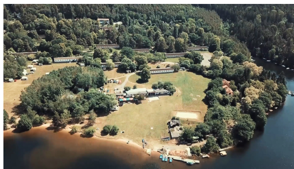
Areál Rabyně.

Jenže když na to přišlo, ukázalo se, že Smetkovi už pozemky dávno nepatří. Navzdory plombě je katastr už v roce 2006 přepsal na nového majitele.