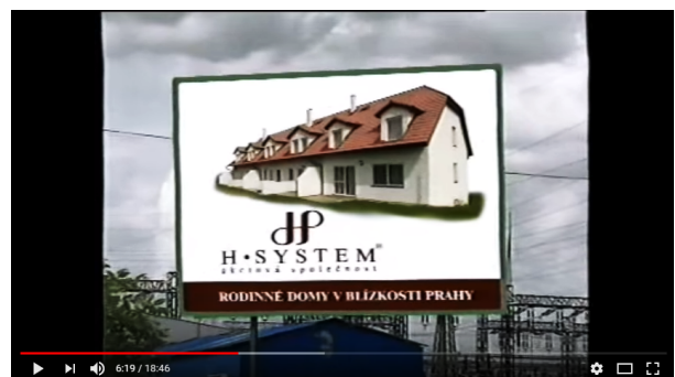
Z propagačního videa H-Systemu.

Jak to dopadlo, už několik let víme. Z H-Systemu se stal jeden z největších podvodů novodobé historie. Tisícovka lidí toužících po novém bydlení přišla často o své celoživotní úspory. Celkově utopili klienti H-Systemu v projektu dostupného bydlení miliardu korun. O další miliardu pak přišly banky.