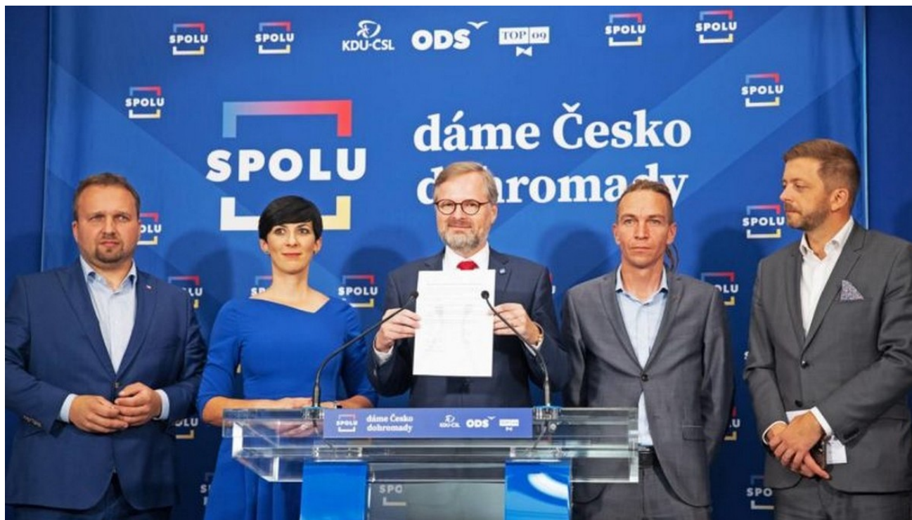
Memorandum SPOLU (ODS, TOP 09, KDU-ČSL) a PIRSTAN (Piráti a STAN) po sněmovních volbách 2021

Počátkem listopadu 2021 si poslanci v tajné volbě na ustavující schůzi nové sněmovny do svého čela zvolili kandidátku SPOLU Markétu Pekarovou. Nová předsedkyně v projevu po svém zvolení směrem k veřejnosti uvedla: „Já se budu snažit ze všech sil, abych právě důvěru v naši komoru parlamentu, tedy v Poslaneckou sněmovnu, zvyšovala. Je to úkolem nás všech, ale já se budu snažit v tomto být v čele těch, kteří se o to snaží.“ V reakci na Kverulantova zjištění slíbilo vedení Poslanecké sněmovny omezit jeden z velmi viditelných benefitů práce českých zákonodárců – zahraniční služební cesty.