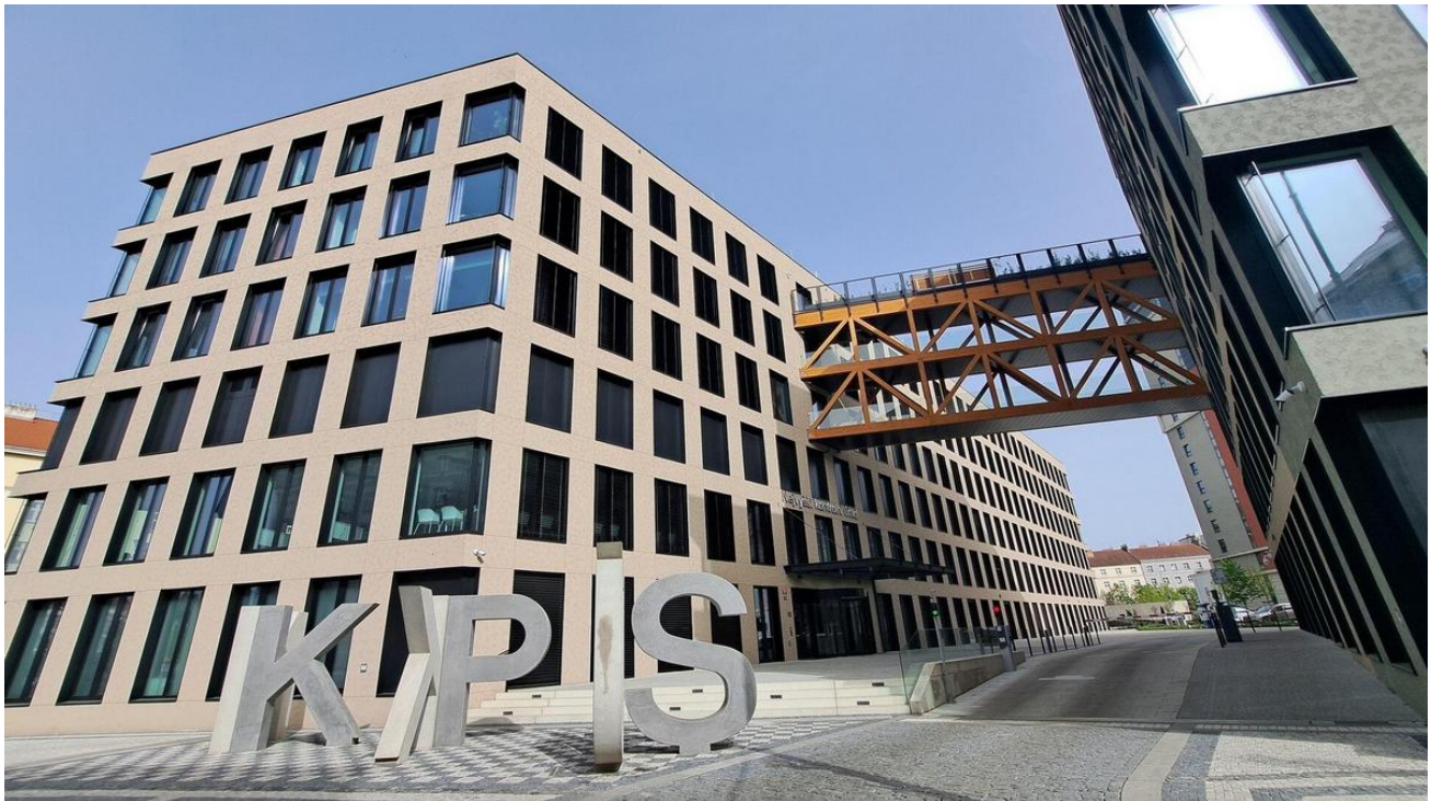
Nová budova NKÚ, Parlamentní knihovny_a_Archivu_PS_v_Holešovicích

Kverulant zjistil, že v kapitole stroje, přístroje a zařízení se mimo jiné skrývají takové položky jako „Modernizace reproduktorové soustavy v sále A111“ za 1,34 milionů korun, „Vybavení prostor archivu PS interiérovým nábytkem – Holešovice“ za 795 tisíc a „Mobilní knihovní regálové systémy Holešovice“ za 27,53 milionů.