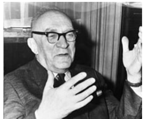
Евсей Либерман в 1967 году

института и Харьковского государственного университета Евсея Либермана «План, прибыль, премия» [8] . Хотя Либерман и был представителем провинциального вуза [9] , он принадлежал к достаточно влиятельной в тот период харьковской школе экономистов, связанной с выдвинувшейся во времена Хрущёва «харьковской» группой в партийно-