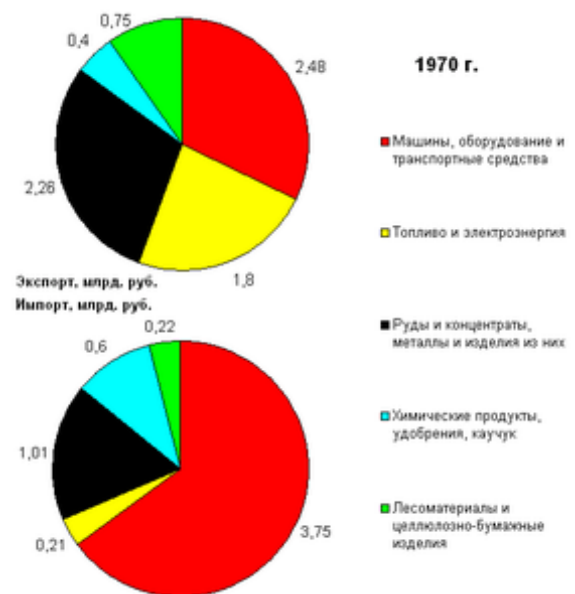
Структура внешней торговли СССР в 1970 г.

Неблагоприятным фактором для развития реформ мог также быть рост поступлений от экспорта нефти (так, открытое в 1965 году Самотлорское нефтяное месторождение было пущено в