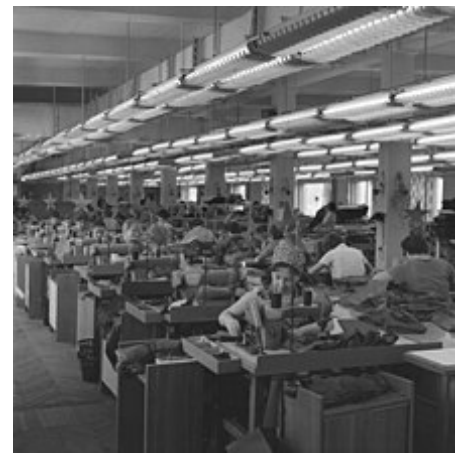
Производственный цех «Большевички» в 1967 году

швейных объединения, московская « Большевичка » и горьковский «Маяк», получили право работать по заказам торговли; в 1965 году эти эксперименты были расширены и на другие предприятия в европейской части СССР. Участвовавшие в эксперименте предприятия могли сами устанавливать себе планы по объему производства и номенклатуре продукции; единственным директивным показателем для них оставалась прибыль. Работа переведенных на новую систему предприятий оценивалась по выполнению принятых ими планов перед торговыми предприятиями и плана по прибыли. Эксперимент с грузовыми автоперевозками, также расширенный в 1965 году, к 1967 году был прекращён — автоперевозчики стали лучше удовлетворять потребности клиентов, но потеряли интерес к припискам, что снижало показатели грузооборота на бумаге [15] .