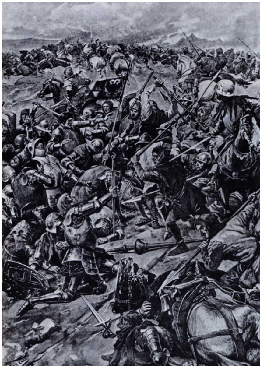
Foto: Vyobrazení bitvy u Ústí (Věnceslav Černý) | Wikimedia Commons / CC BY-SA 3.0