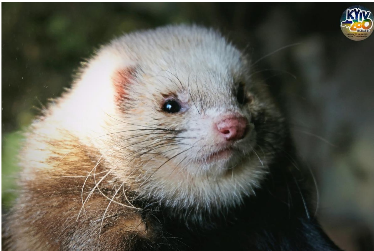
Kyjevská zoo dojata příběhem o záchraně malých fretek

Kyjevského zoologického parku národního významu se dotkl příběh o záchraně celé rodiny fretek - fretek domácích, které byly do ústavu přivezeny na jaře roku 2022.