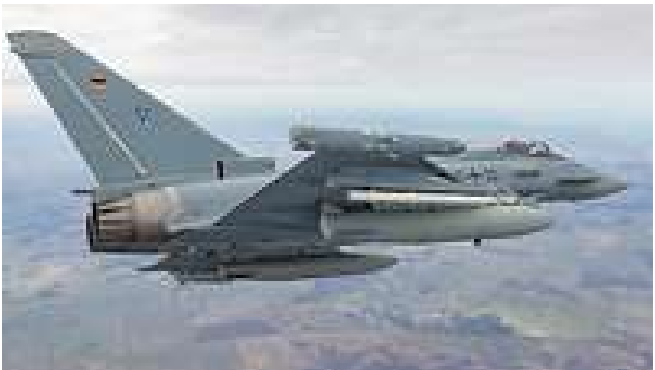
A Eurofighter from Tactical Air Wing 73 "Steinhoff" in Laage during a ferry flight