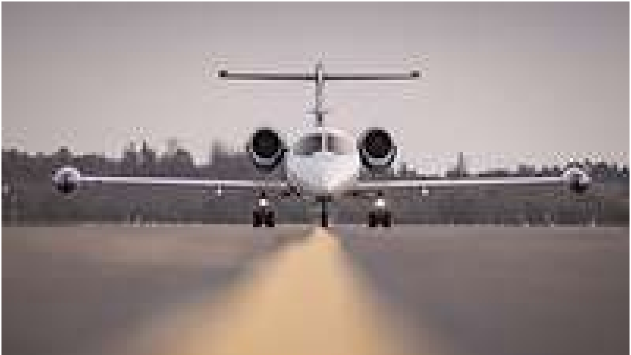
A GFD (Gesellschaft für Flugzieldarstellung) Learjet takes off from Hohn Air Base with Tactical Air Force Squadron 51. Two of these aircraft will be part of Air Defender.