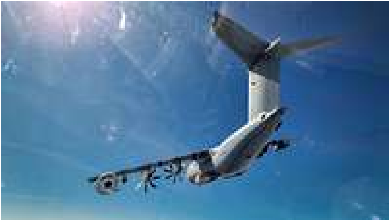
A400M transport aircraft takes off to refuel Czech fighter jets as part of a certification of Czech pilots in German airspace