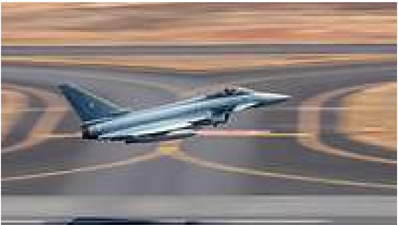
A Eurofighter from Tactical Air Wing 74 takes off from the Royal Australian Air Force site during Exercise Kakadu 2022. Thirty German Eurofighters will take part in the Air Defender exercise.