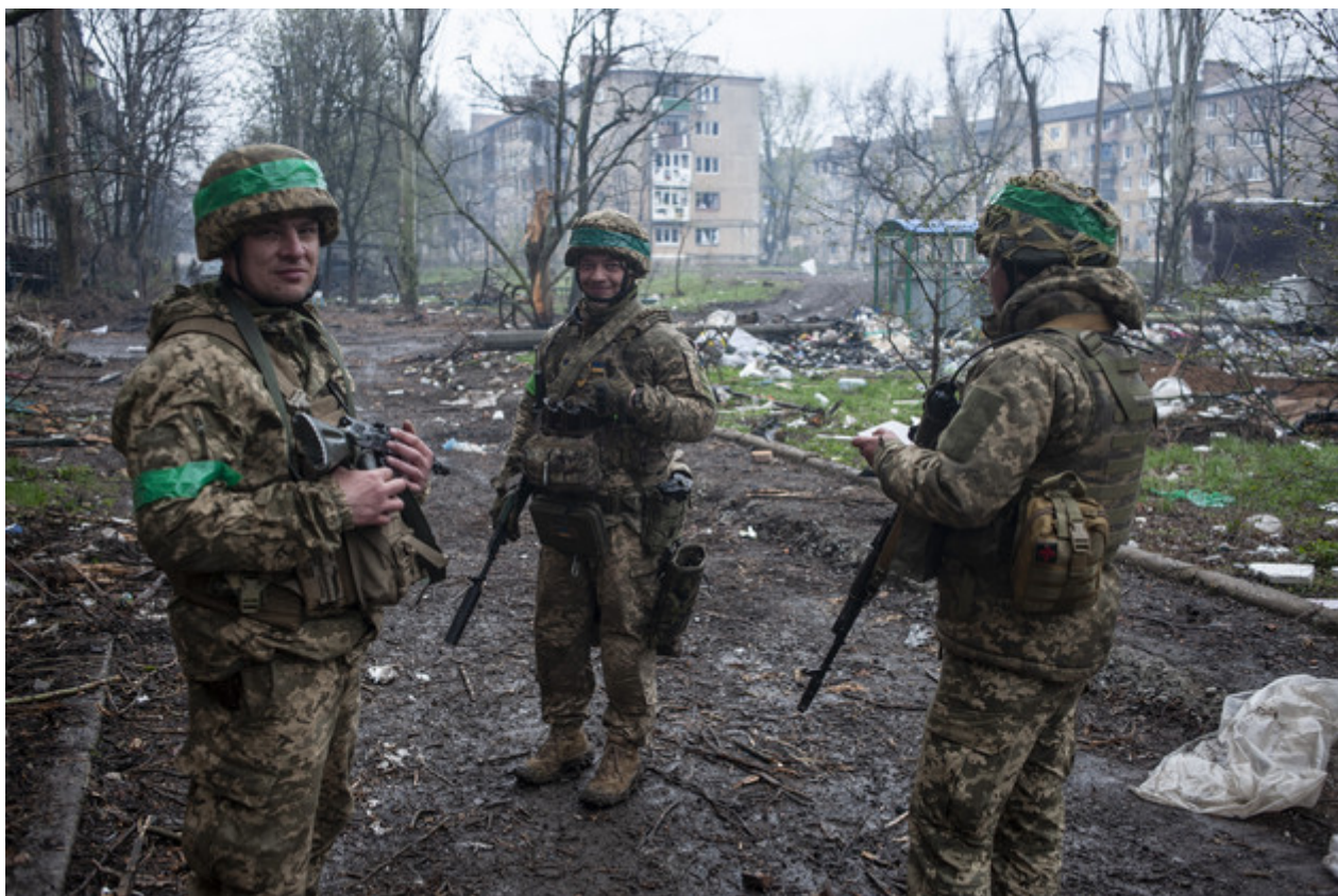
Ukrajínští vojáci si povídají ve válkou zasaženém Bachmutu.

Obě strany si vyměnily trestuhodné rány, zaměřené na malá města, jako je Bakhmut, přičemž žádná z nich nebyla schopna úplně vytlačit druhou. Ruská vlna nařízená na začátku tohoto roku, která měla oživit bojující válečné úsilí Moskvy, zabrala malé území za cenu značných ztrát a neudělala mnoho pro změnu celkové trajektorie konfliktu.