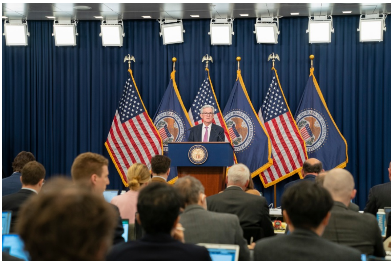
Předseda Federálního rezervního systému Jerome Powell.

Zde je rekapitulace toho nejdůležitějšího, co řekl předseda Fedu Powell po posledním zvýšení sazeb a turbulencích v bankovním sektoru.