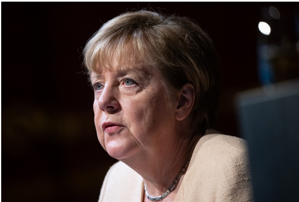
Na snímku bývalá německá kancléřka Angela Merkelová

NATO téměř okamžitě začalo dodávat Ukrajině zbraně za miliardy dolarů. A válka se stupňovala. Mírové dohody z Minska 1 a Minska 2, jejichž spolugaranty měly být Francie a Německo, nefungovaly jednak proto, že nacionalistická ukrajinská vláda v Kyjevě je odmítla plnit, a jednak proto, že Německo a Francie netlačily na jejich plnění, jak nedávno přiznala bývalá kancléřka Angela Merkelová.