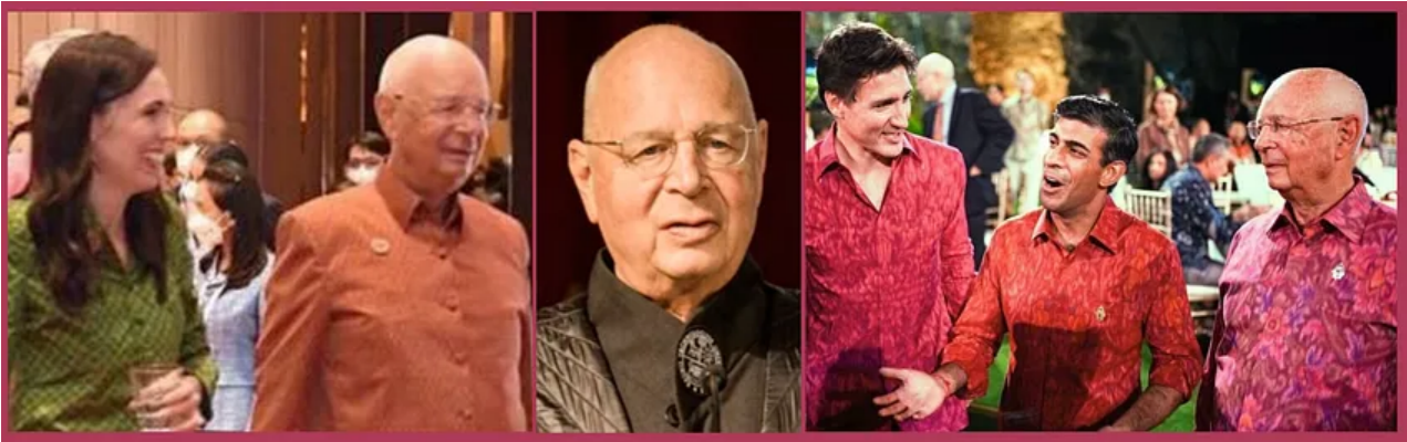
Klaus Schwab at the G-20 meeting in Indonesia last year with New Zealand Prime Minister Jacinda Ardern (left) and with Canadian and British Prime Ministers Justin Trudeau and Rishi Sunak (right).