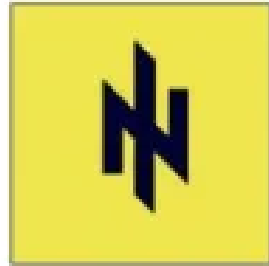
Logo du parti SVOBODA (1 ère version)