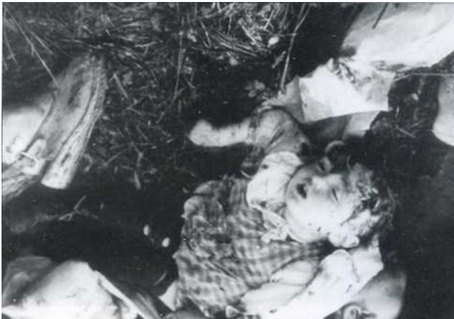
Belzec, újezd Rava Ruska, vojvodství Lvov, 16.června 1944. Místo masakru v lese.