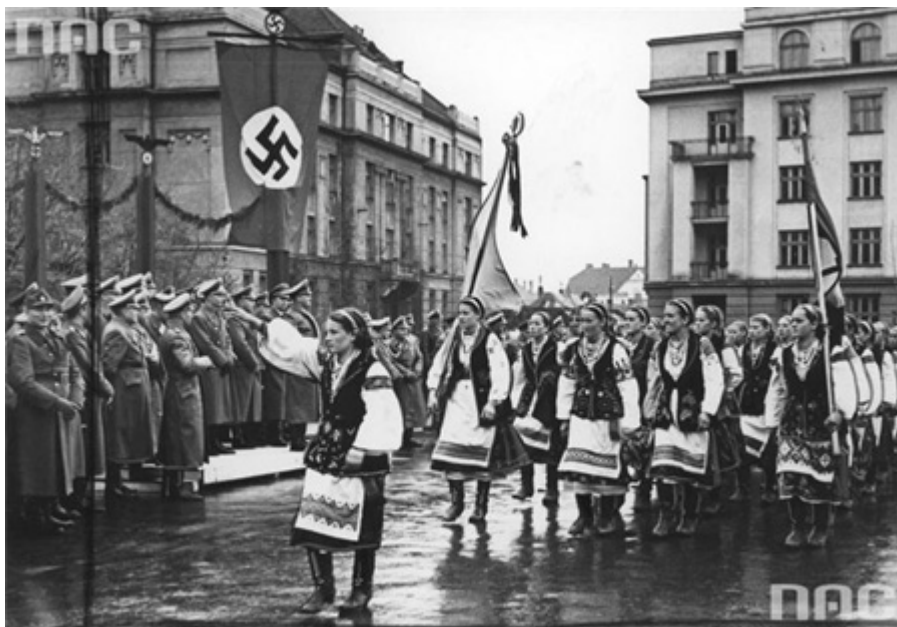
Narodove Archiwum Cyfrowe, sygn. 2-3022

Organizace ukrajinských nacionalistů (Banderovske hnutí) / OUN (b), OUN-B / nebo revoluční / OUN (p), OUN-P / také jako (krátkodobě v roce 1943) / OUN (CQ), OUN-SD / (укр. Організація українських націоналістів (бандерівський рух) – jedna z frakcí ukrajinských nacionalistů. V současné době (od roku 1992), se za nástupce OUN (b) označuje Kongres ukrajinských nacionalistů.