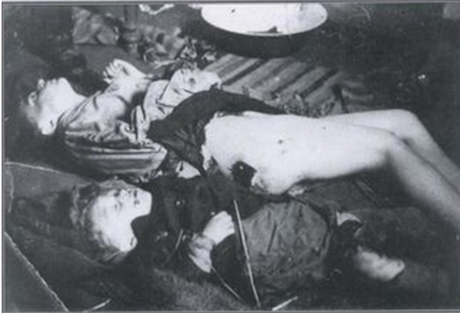
Belzec, újezd Rava Ruska, vojvodství Lvov, 16.června 1944.