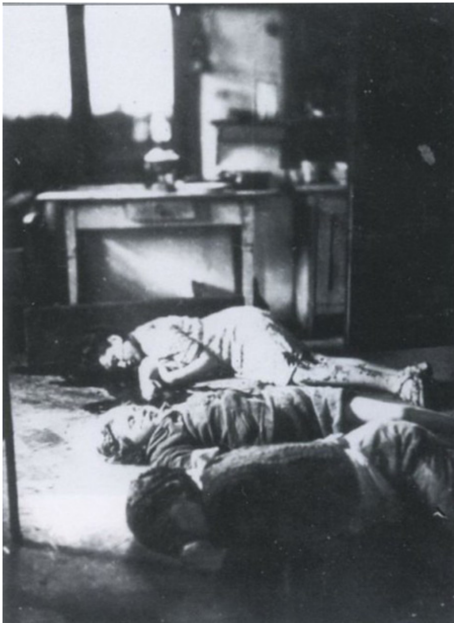
Polská rodina Sajer, matka a dvě děti, podřezané ve svém domě v Vladivopole v roce 1943.