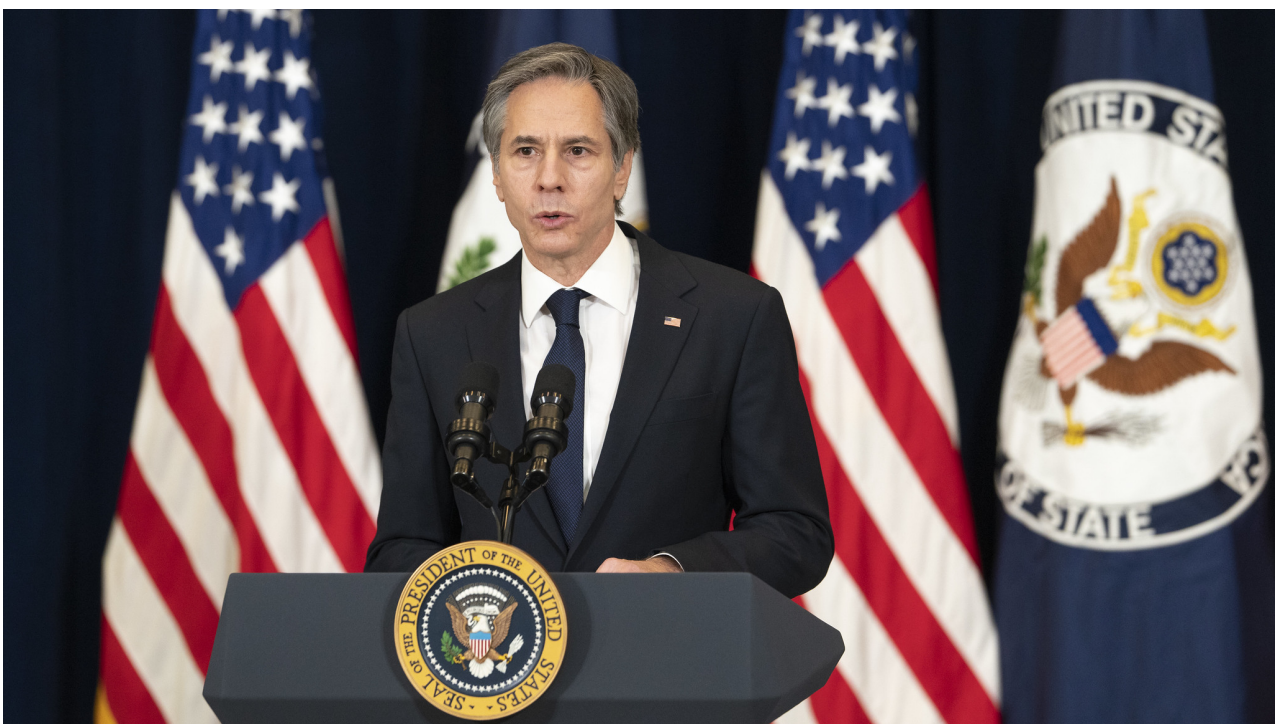
Ministr zahraničí Antony Blinken.

Blinken dále prohlásil, že USA budou pracovat na zmírnění „důsledků“ útoku plynovodu na Evropu, s odkazem na poskytování amerického LNG za přemrštěné ziskové marže pro americké dodavatele – další „příležitost“.