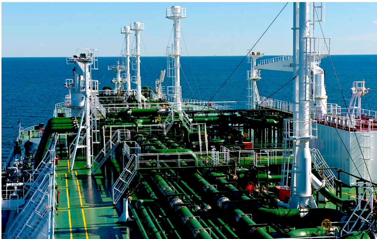
Paluba LNG tankeru Energy Atlantic v Port Arthur, Texas, 2016.

Ale 21 miliard m 3 nemohlo začít kompenzovat množství zemního plynu dodávaného Ruskem do Evropy v případě jakéhokoli rozsáhlého přerušení ruských dodávek energie způsobeného uvalením ekonomických sankcí zaměřených na ruský energetický sektor.