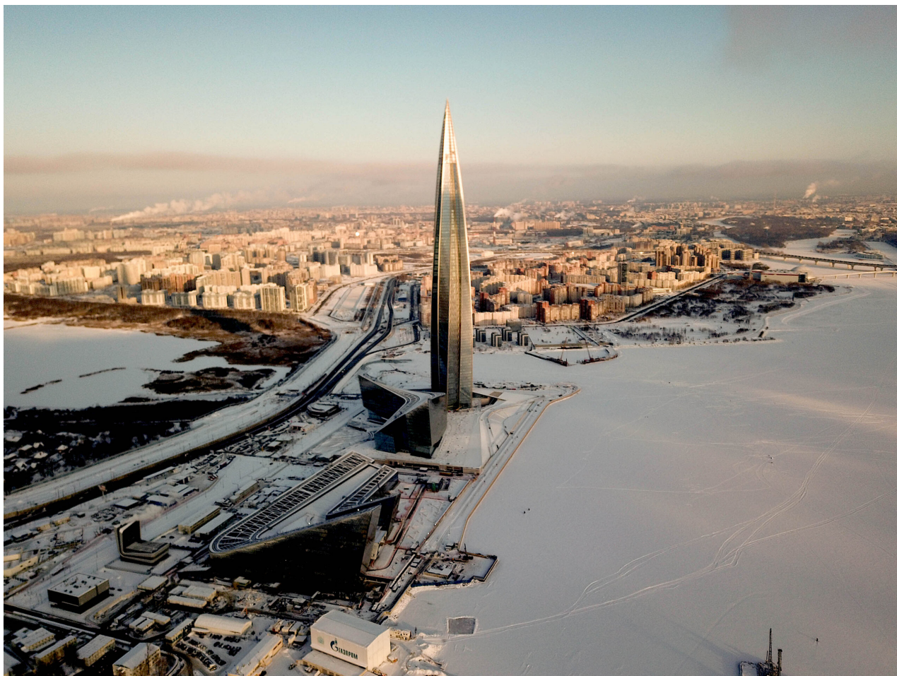
Centrála Gazpromu v mrakodrapu Lakhta Center v Petrohradě, Rusko, únor 2021.

Argumentoval jsem tím, že „Rusko se nikdy nesnažilo využít svůj status hlavního dodavatele energie do Evropy jako prostředek politického vlivu,“ a poznamenal jsem, že: