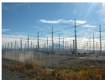
HAARP na Aljašce

Souřadnice: 62°23'30" s. š., 145°9'0" z. d. ( mapa )