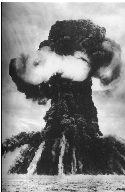
Dne 29. srpna 1949 v kazašské stepi poblíž Semipalatinska Sověti provedli první pokusný výbuch jaderné bomby (foto z knihy Davida Hollowaye Stalin a bomba: Sovětský svaz a jaderná energie 1939–1956. Praha, Academia 2008

v letech 1948 a 1949 a poté v Severoatlantické smlouvě z dubna 1949. Zdá se, že atomová bomba měla dvojitý efekt na Sovětský svaz, když jej nabádala k obezřetnosti a umírněnosti, zároveň ale posilovala jeho odhodlání nevypadat slabě a vydíratelně. Stalinovou politikou bylo sestrojít sovětskou atomovou bombu co nejrychleji, a otupit tak využitelnost bomby jako nástroje americké diplomacie. Ve svých veřejných prohlášeních význam bomby zlehčoval, přitom ale dával sovětskému atomovému projektu nejvyšší prioritu.