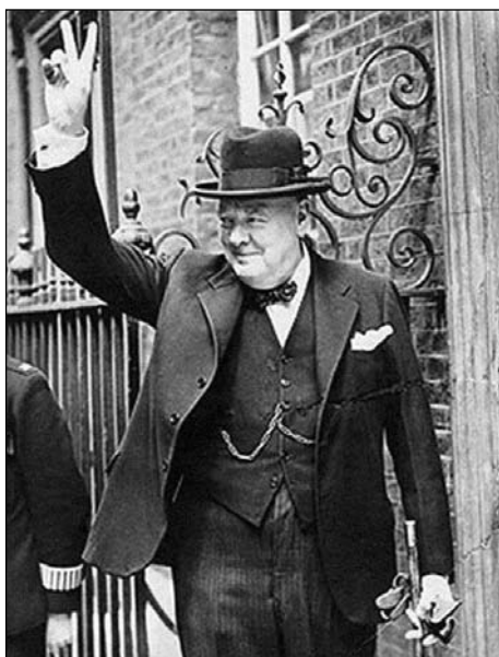
Sir Winston Churchill (1874–1965) nazval poslední díl svých válečných memoárů výstižně Triumf a tragédie. Sovětský postup na osvobozených územích ho vedl až k úvahám, zda proti Moskvě nepoužít síly. Operace dostala rovněž výstižný název: „Nemyslitelné“

Churchill spojoval s atomovou bombou velká očekávání. Jak naznačují jeho poznámky z Postupimi, spatřoval v ní potenciální odstrašující prostředek a věřil, že změní poměr sil, který se v Evropě vytvářel. Bomba však neměla v Evropě žádný bezprostřední efekt a sedm měsíců po Hirošimě, 5. března 1946, pronesl Churchill svůj proslulý projev, v němž odsoudil spuštění železné opony napříč kontinentem. S tím, jak se rozvíjela studená válka, rozdělení kontinentu se prohlubovalo. Spojené státy podpořily hospodářskou obnovu západní Evropy prostřednictvím Marshallova plánu, zatímco ve východní Evropě Sovětský svaz upevňoval své panství; zvláště přelomo-