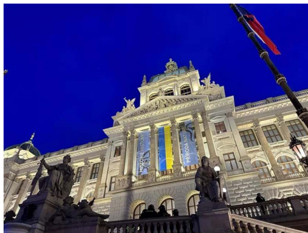
Vlajka Ukrajiny v Národním muzeu v Praze

Demonstranti chtěli z budovy Národního muzea odstranit ukrajinskou vlajku, policie ale zablokovala hlavní schodiště před muzeem.