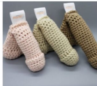
Lil' Bug® Soft Packer - Weighted