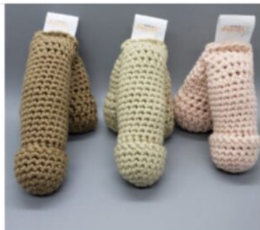
Lil' Bug® Soft Packer