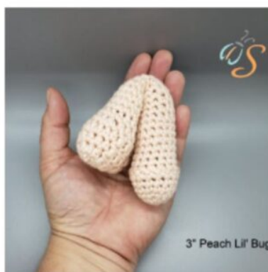
3" Peach Lil' Bug

Stitchbug dal svým zákazníkům doporučení, ve kterém uvádí: