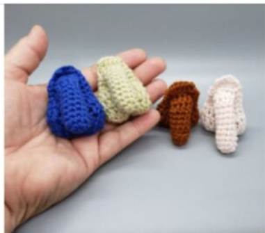
Bitty Bug® Soft Packer