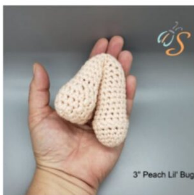
3" Peach Lil' Bug