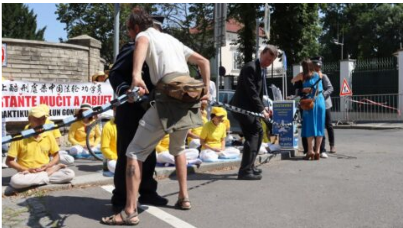
Osobnosti u příležitosti 25 let perzekuce Falun Gongu přetrhly před čínskou ambasádou symbolický řetěz