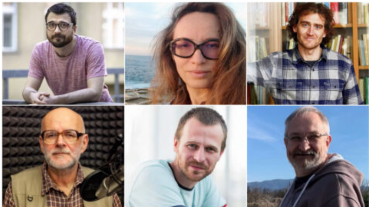
Čeští experti chtějí založit nezávislý vědecký institut kvůli „politizaci vědy“