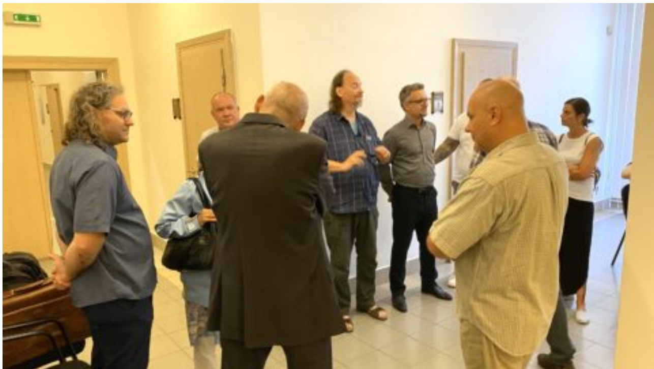
Zakladatelka první školy tradiční čínské medicíny odešla ze soudní síně a práskla dveřmi. Pokračování případu Coriolus