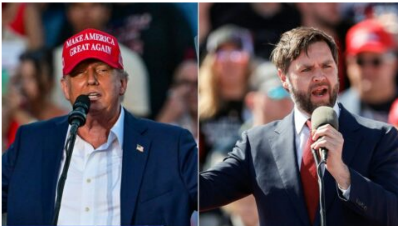
Vidlákova cesta do Washingtonu