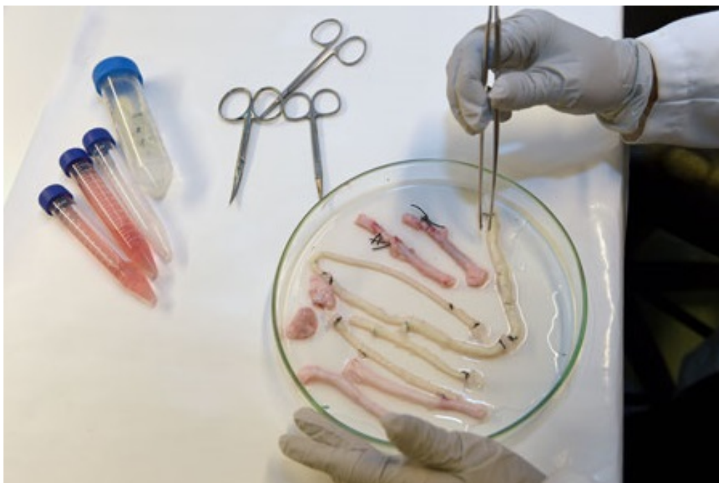
Umělé krevní cévy

Níže jsou obrázky uměle vypěstovaných krevních cév od laboratorních vědců.