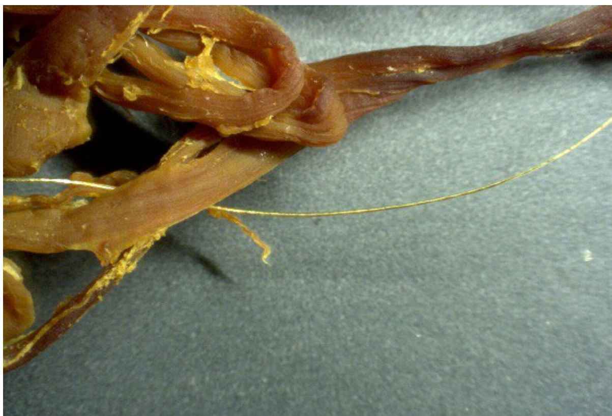
Zlatý nanodrážek – InfoWars

Věřím, že obrázek níže, který sdílel Mike Adams na InfoWars, ukazuje zlatý nanodrážek.