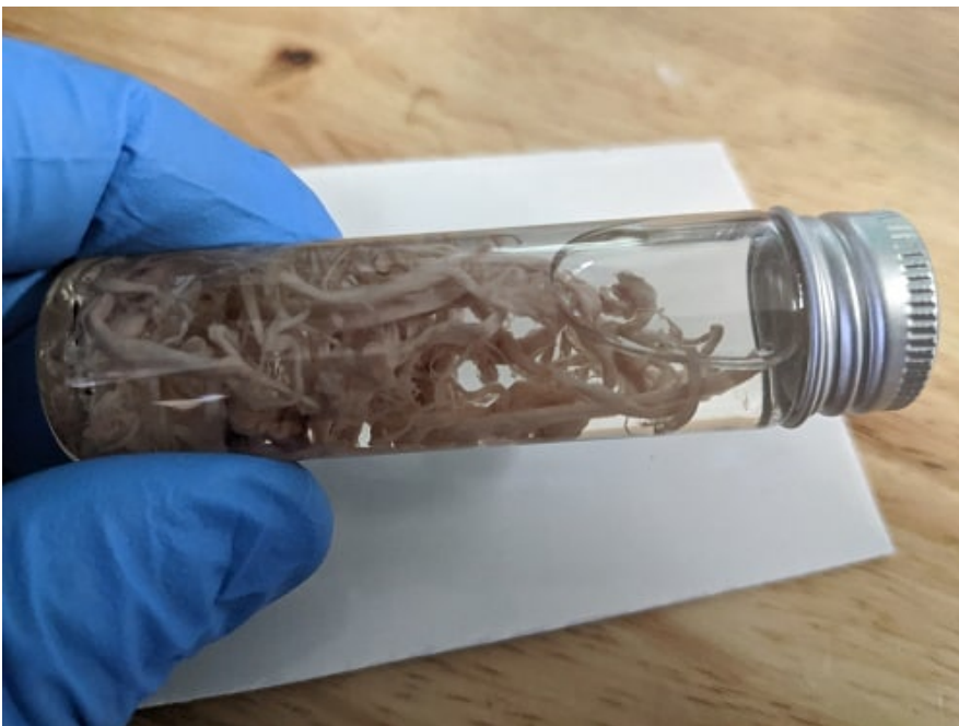
Vzorek balzamovače Richarda Herischmana publikoval Mike Adams z Natural News