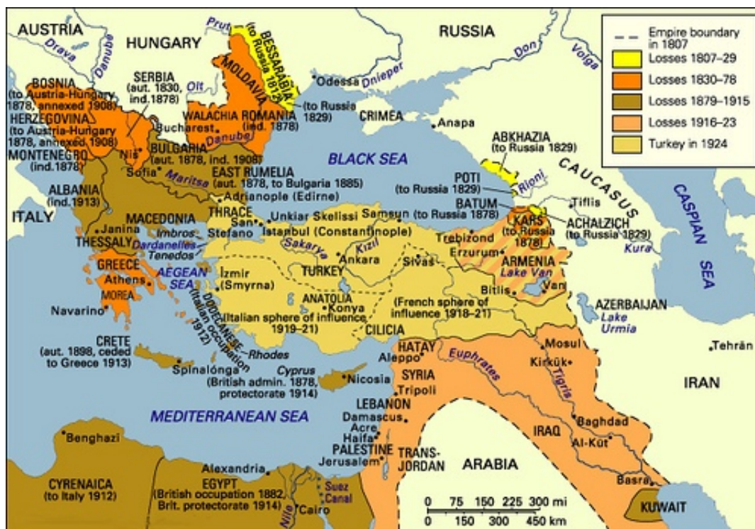
Osmanská říše v letech 1820-1924