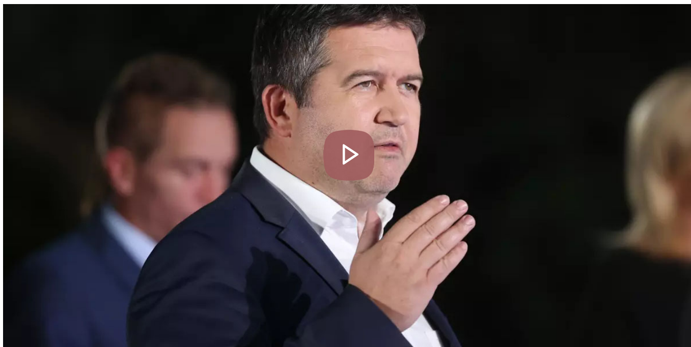
Tisková konference po dnešním jednání krizového štábu. (Video: )